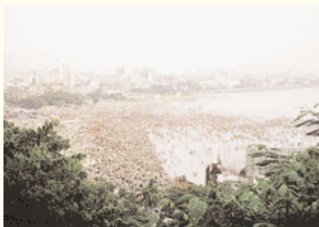
Millions d'indouistes enfonçant leurs statues dans l'eau ملايين الهندوس يجرون أصنامهم إلى الماء

L'Inde est l'un des dix grands pays dans le monde pour différentes raisons. D'abord par l'étendue de son territoire, la diversité de son climat et la beauté de sa nature: la gigantesque chaîne de l'Himalaya, les collines, les plaines, les forêts, les rivières, les cascades et les plages au sable d'or. Ensuite, par sa population considérable qui avoisine 1,1 milliard. De même, son histoire ancienne de plus de 5 mille ans et la multiplicité de ses religions, de ses croyances, ses ethnies et ses langues, font que ce pays a une grande diversité culturelle. Cela est visible sur les nombreux monuments historiques tel que Taj Mahal l'une des merveilles du monde, ainsi qu'à travers des centaines de fêtes et de festivals qui se tiennent à travers le pays. Cela, outre son économie avec son industrie lourde développée et particulièrement son avance en matière de développement de la programmation électronique et de la production de l'énergie nucléaire. Pour l'ensemble de ces facteurs l'Inde est l'une des principales destinations touristiques dans le monde, satisfaisant les besoins de tous ses visiteurs. On disait que celui qui a visité l'Inde a visité le monde