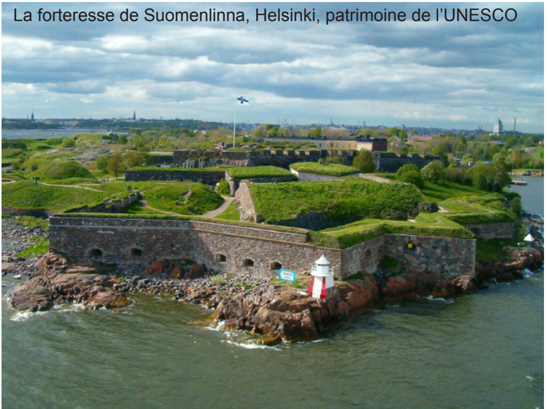
La forteresse de Suomenlinna, Helsinki, patrimoine de l'UNESCO

L'écotourisme permet aux voyageurs d'approcher des animaux sauvages dans leur habitat naturel tout en respectant