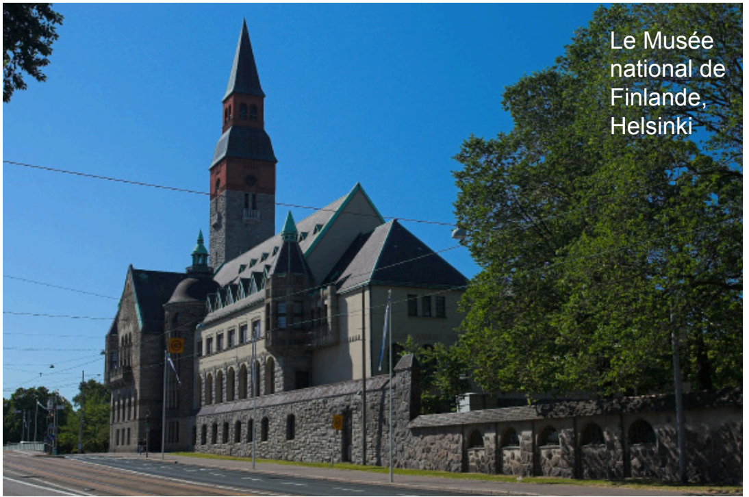
Le Musée national de Finlande, Helsinki

les principes du tourisme durable. À l'automne 2011, la campagne Face the Wild (À la rencontre de la nature) de Visit Finland a mis à l'honneur les paysages exceptionnels de la Finlande et ses animaux sauvages dans les rues de Londres, Manchester et Paris. Les œuvres des photographes mondialement connus Jari Peltomäki, Olli Lamminsalo et Markku Tano vous permettront de découvrir la vie sauvage à l'état brut de la Finlande dans toute sa splendeur.