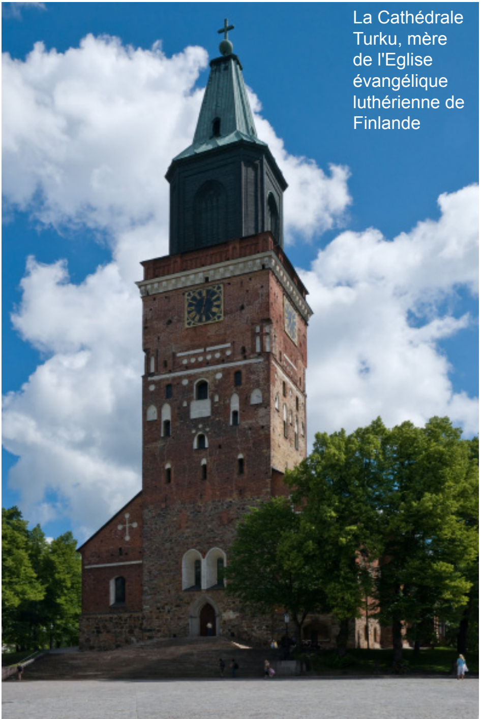
La Cathédrale Turku, mère de l'Eglise évangélique luthérienne de Finlande