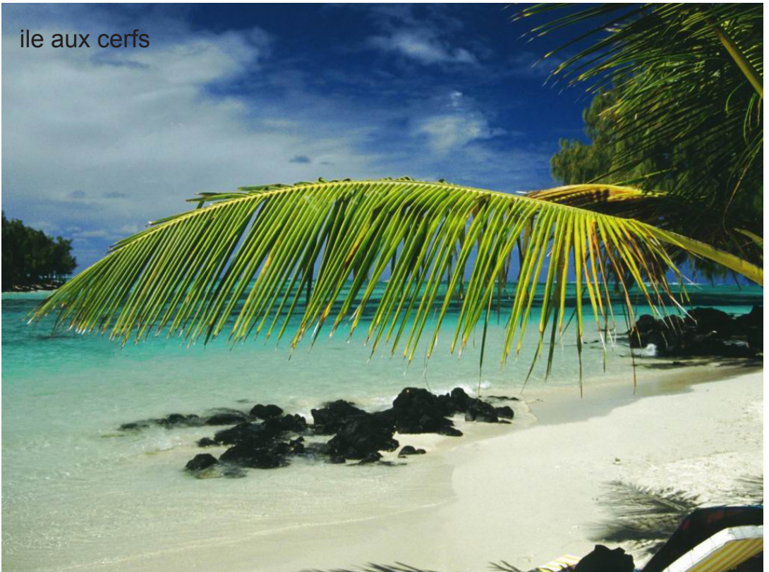
île aux cerfs

Avec la montée des puissances ibériques, le traité de Tordesillas de 1494, qui établissait le partage du monde entre le Portugal et l'Espagne, va laisser le champ libre aux portugais en Afrique et dans l'océan Indien. Les portugais vont détourner à leur profit le commerce des épices, de l'or, de l'ivoire et des esclaves. Cela va porter un coup dur au commerce