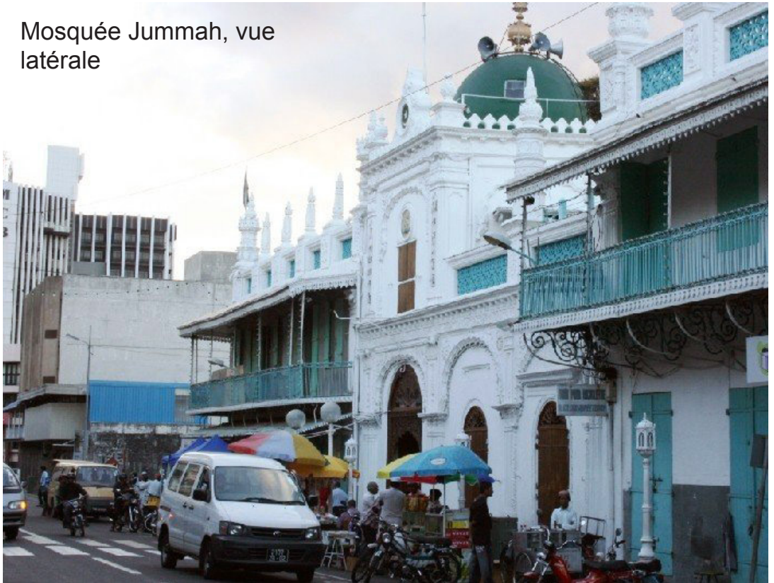
Mosquée Jummah, vue latérale

Les débuts de la colonie furent très lents, les hollandais ayant centré tous leurs intérêts sur Java, principal producteur d'épices. Ce n'est qu'en 1638 qu'ils installèrent une première colonie à Grand Port et l'exploitation du bois d'ébène en fut le principal mobile. Puis une seconde colonie fut installée à Flacq. Mais les conditions de cette colonisation furent difficiles: épidémies, intempéries, invasions de rats, de sauterelles qui détruisaient les récoltes.