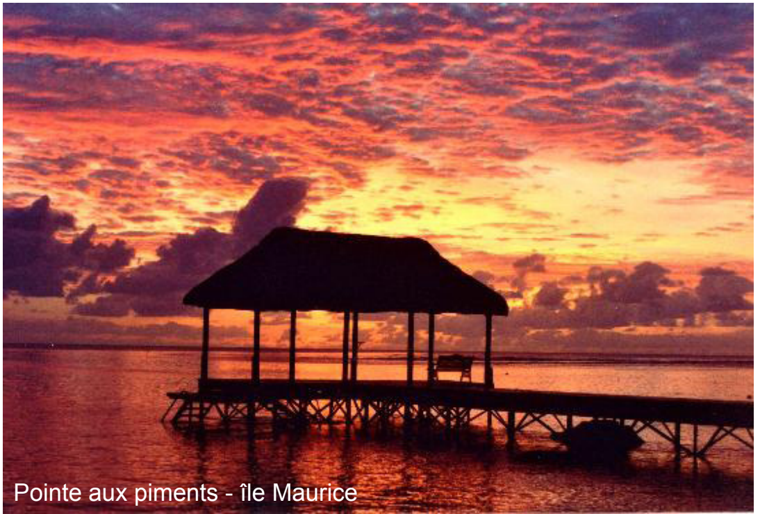
Pointe aux piments - île Maurice

- Aquarium de l'île Maurice : De nombreux bacs répartis dans cinq salles vous permettront d'admirer des exemples de la riche faune aquatique que l'on peut trouver dans et autour de cette belle île tropicale. Le plus grand bac, 'Grand Bleu', de plus de 15 mètres, contient toute une variété de créatures de l'océan, qui pourront être observés de très près « sans la crainte d'être mangé ! » Un « touch pool » permettra aux petits visiteurs de « toucher » une variété de spécimens marins - Domaine Les Pailles : Le