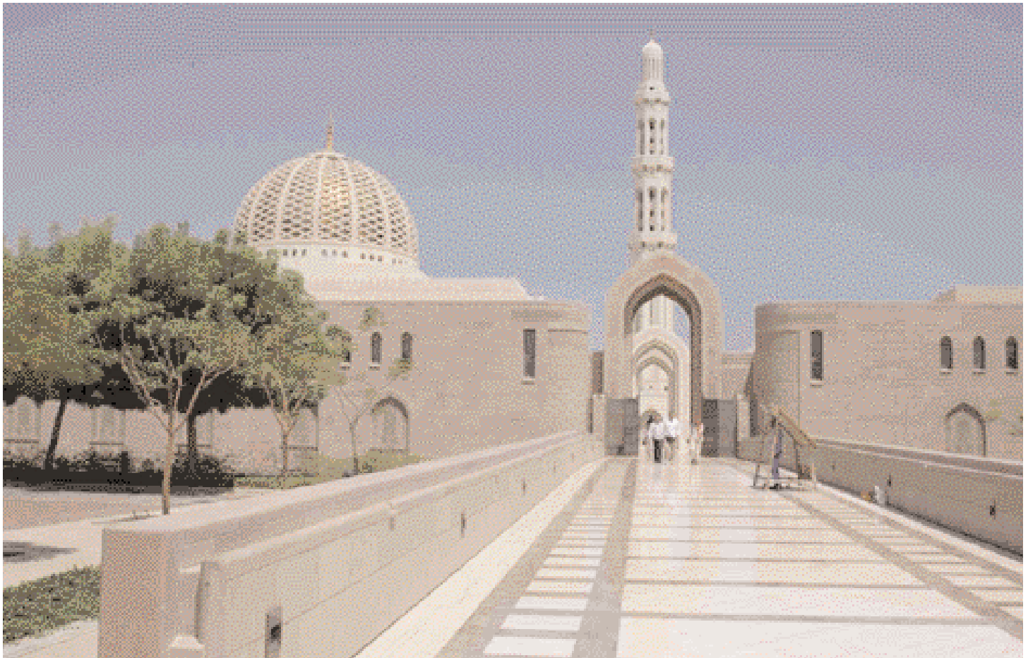
The Sultan Qaboos Grand Mosque.

المساجد الجميلة توشح الطبيعة في عمان مضافة عليها صفة واضحة جدا لمحيط إسلامي. وعمان هي من أول الدول التي دخلت الإسلام خلال حياة النبي محمد (صلى الله عليه وآله وسلم).