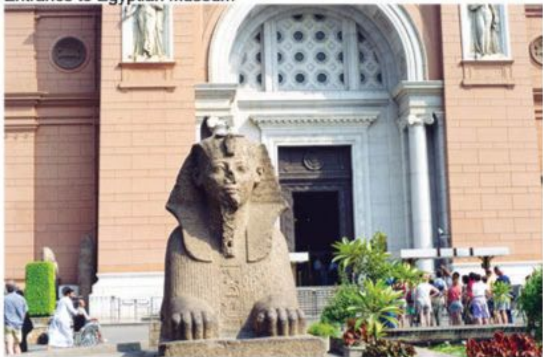
Entrance to Egyptian Museum

C'est une soirée d'ouverture à ce berceau de la civilisation. pays de 5000 ans de mystère, souvent désigné comme le Le banquet a annoncé le spectacle