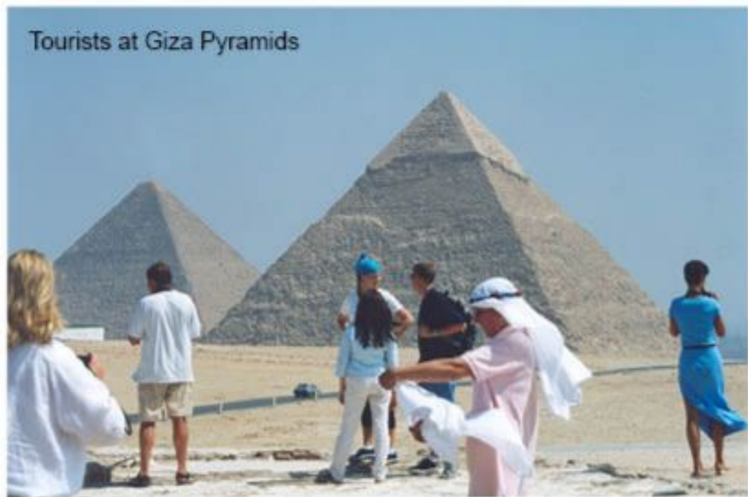
Tourists at Giza Pyramids

Nous avons passé une grande partie de notre dernière journée