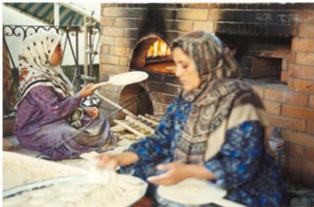
Ladies baking bread

manger à un moment comme celui-ci, même s'il s'agissait d'un banquet.