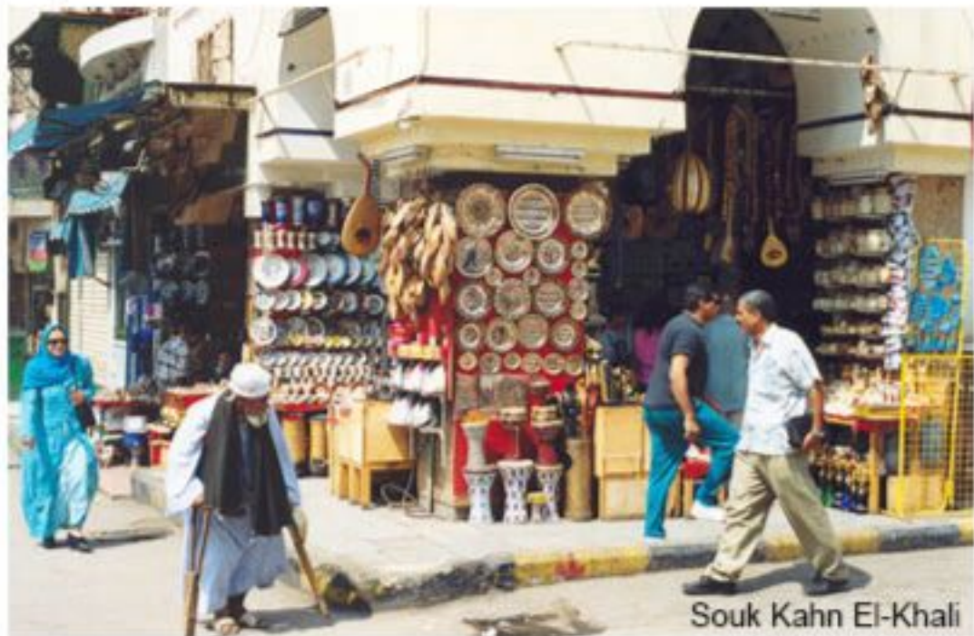
Souk Kahn El-Khali

Mais la nuit, Le Caire devient une belle femme. Les lumières des