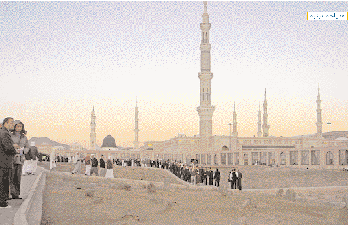
Cimetière Al Baqii à côté de la Mosquée du Prophète