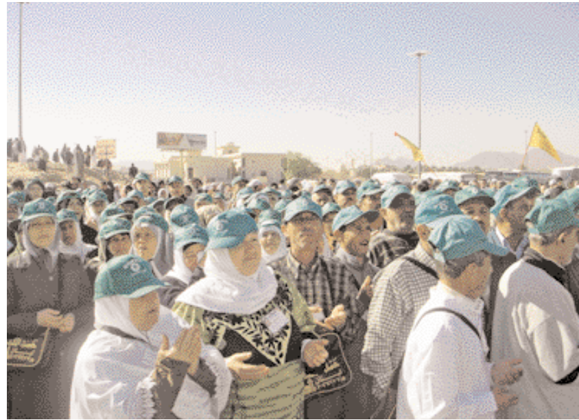
Pélerins libanais près de la Tombe de Hamza