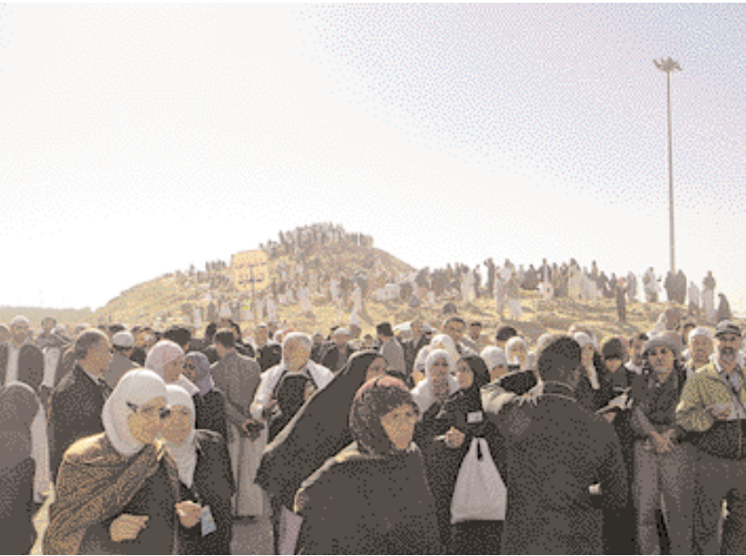
Site de la Bataille d'Uhud