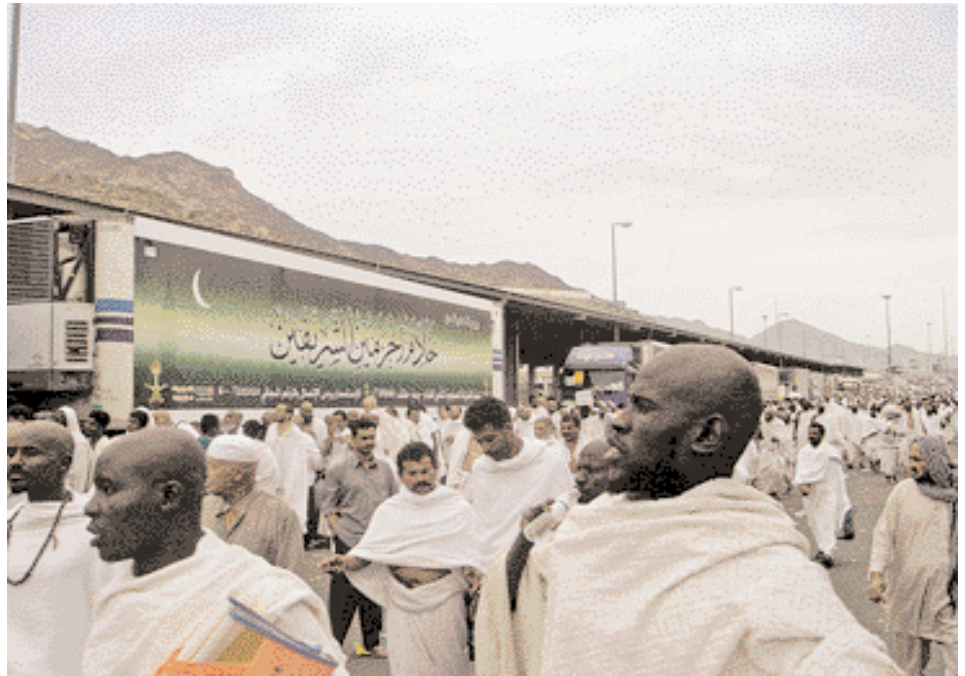
شاحنات توزيع الطعام والمشروبات مجانا في الطريق الى منى Distribution gratuite de nourriture sur la route de Menna

وقد قمنا خلال إقامتنا في المدينة المنورة بمحاولات عديدة لزيارة مقبرة البقيع، وهي تفتح في أوقات محددة ويتزاحم على دخولها الكثير من الحجاج وخاصة الموالين لأهل البيت (ع)، فوقفنا في بعضها ودخلنا البقيع، وفي الأوقات الأخرى صرنا على مقربة من المقبرة، أو في الباحة الممتدة ما بين