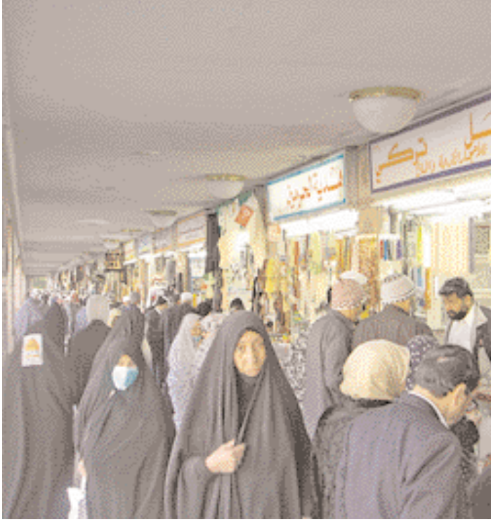
Magasins de présents à Médine