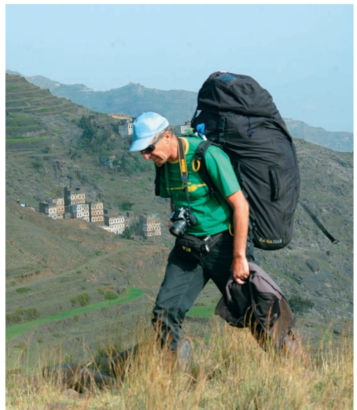
Randonnée en montagne