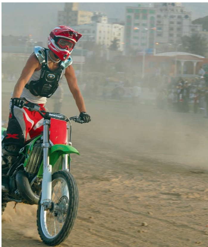
Course de motos

- La nouveauté au ministère, en matière de promotion touristique de notre pays à l'étranger, consiste à continuer à participer activement dans les expositions internationales, à œuvrer à participer dans de nouvelles expositions et régions du monde, et à diversifier la participation et la présence de haut niveau, en associant activement le secteur privé dans les expositions de tourisme et en participant avec de nouveaux matériaux, brochures et produits touristiques. ■