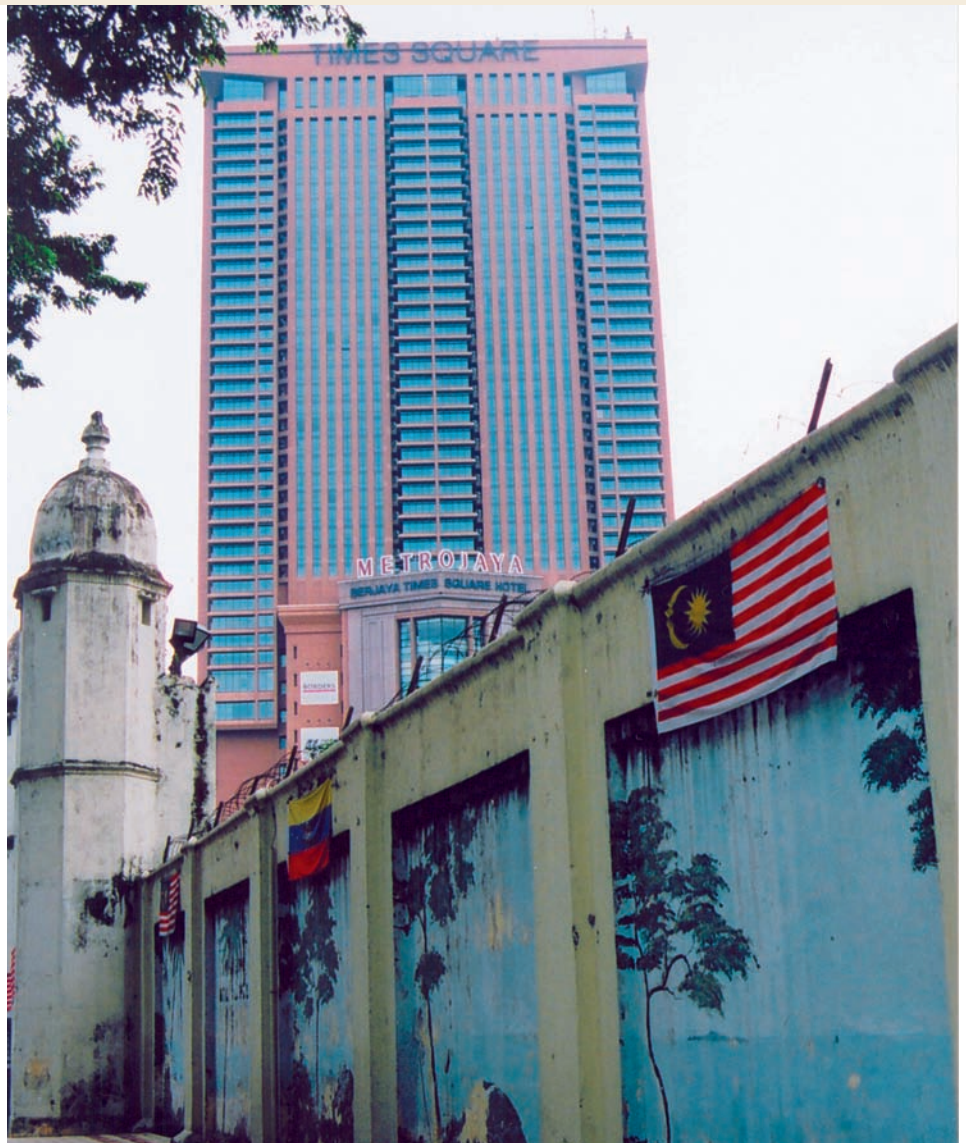
Vue sur la prison Pudo avec l'hôtel

Aujourd'hui, il n'est plus étonnant de trouver des hôtels cinq étoiles à côté des musées, voire même des prisons musées. Quelques années auparavant, les touristes pouvaient visiter l'ancien pénitencier avec ses étroites cellules aux minuscules fenêtres, sa redoutable place de bastonnade, et même la salle de pendaison et la plate-forme de fouettage. Mais, par la suite, les choses ont changé. Le projet de transformer la prison en musée fut abandonné, tandis que la criminalité s'était accrue notablement, ▶