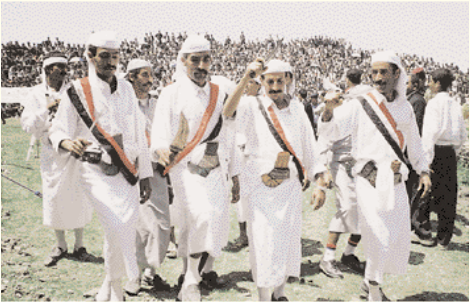
Danse folklorique au festival d'Ibb.