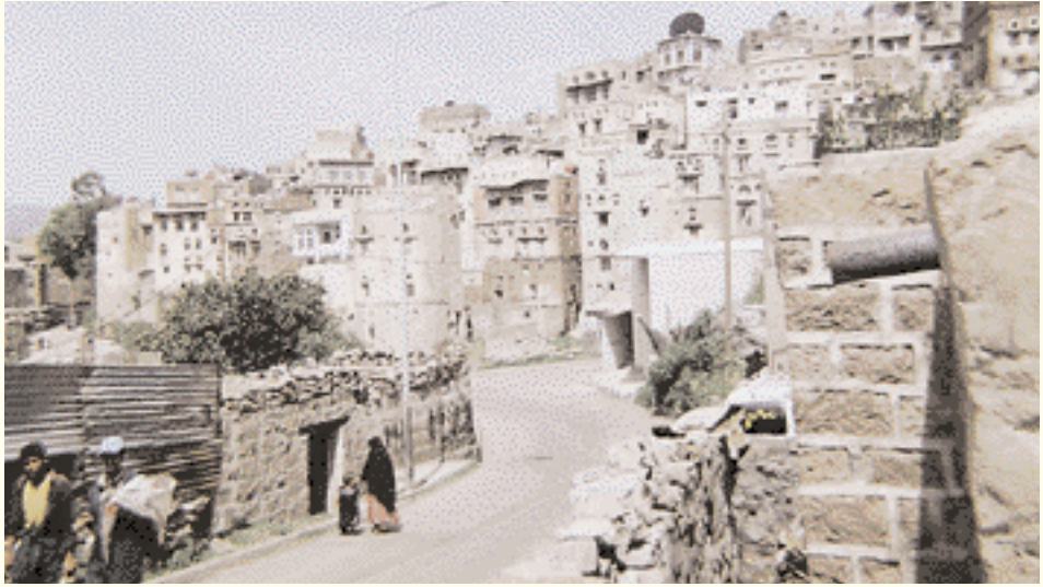
Entrée est d'Ibb.

Etant situé dans un espace montagneux, la province d'Ibb a été un lieu stratégique pour la construction de forts et de forteresses. Elle en a plusieurs, dont les plus importantes sont : fort Attaakor, fort Hob, fort Al Qaher, fort Al Manar, fort Samara, fort Kahlan, fort Kahal, forteresse Khodo et forteresse Samara. ■