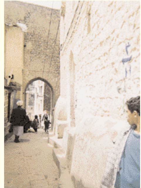
Vieille porte d'Ibb. أحد الأبواب القديمة لمدينة إب.

Ibb est près de la région Taz, soit à une heure de route. La distance étant courte, je n'ai cessé de demander au chauffeur de taxi d'aller lentement. Etonné, celui-ci me demanda : «pourquoi ralentir?»