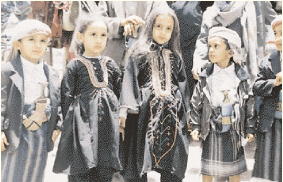
Costumes folkloriques au festival d'Ibb.

عرض فلكلوري للأزياء الشعبية في محافظة إب.