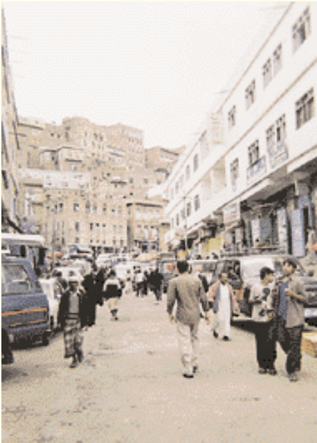
Ancienne Ibb. جزء من إب القديمة.

Dès que j'ai reçu l'invitation au Festival touristique annuel d'Ibb de la part de la Direction d'information et des relations publiques de la région d'Ibb je me suis dirigé vers cette ville dont la nature m'a ensorcelé.