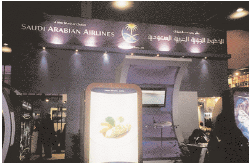
The Saudi Arabia Airlines stand in Milano.

كما قمنا بزيارة معظم أجنحة الدول المشاركة في المعرض ووزعنا أعداد المجلة عليهم وتم تعريفهم بالموقع الإلكتروني لمجلة السياحة الإسلامية. ■