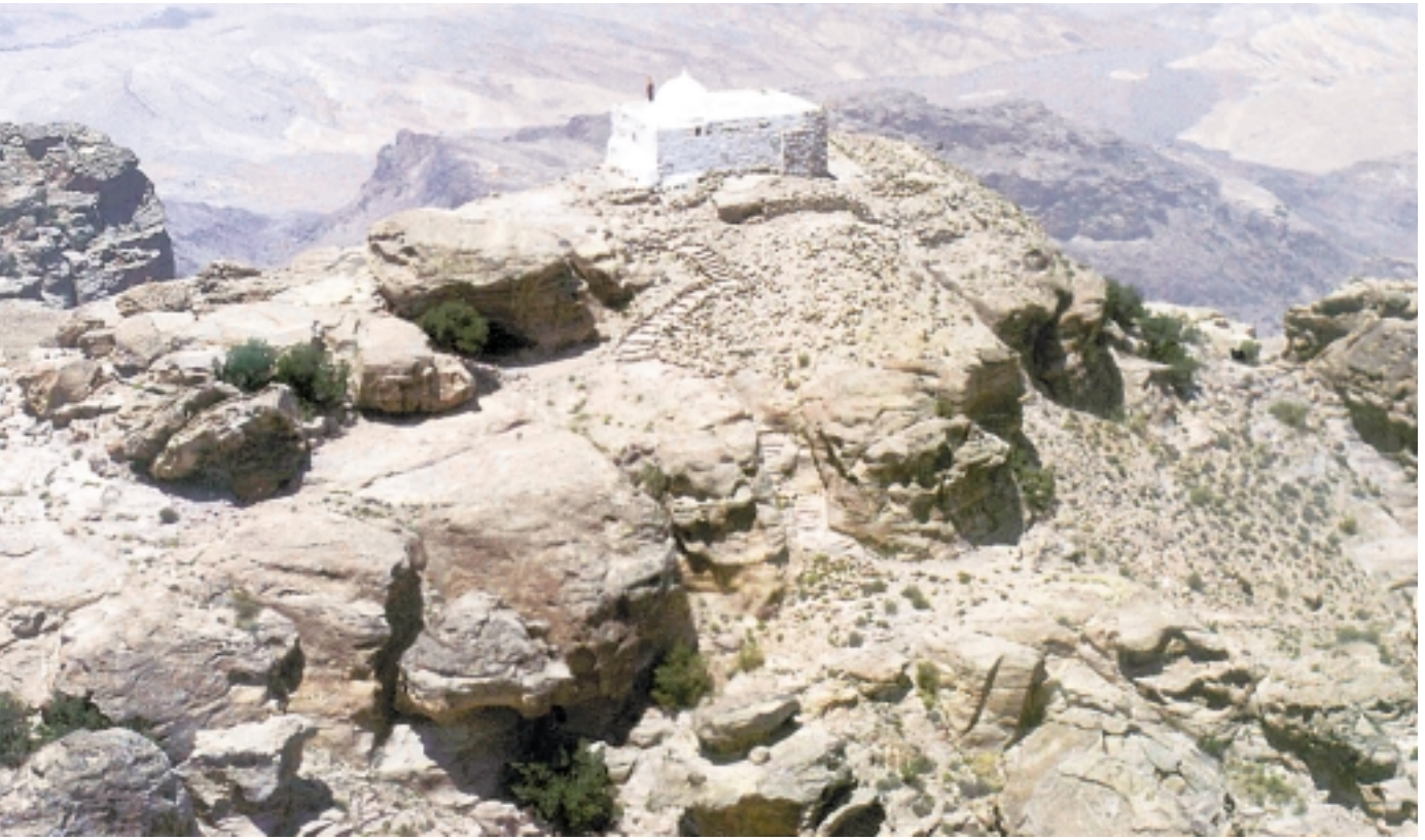
The Mausoleum of Prophet Aaron in Petra