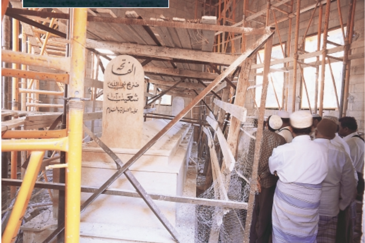
The Mausoleum of Prophet Shoab