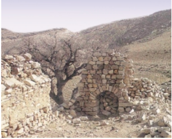
مقام النبي سليمان (ع) The Mausoleum of Prophet Solomon

يقع مقام النبي هود (ع) بالقرب من جرش المدينة الرومانية الكاملة وعلى بعد 65 كم من العاصمة عمان والمقام عبارة عن غرفة تعلوها قبة و أمامها حوش جدد بناؤه من قبل الدولة العثمانية في القرن التاسع عشر. بعث الله هوداً إلى قبيلته (عاد)، وهي من أقدم الأمم وجوداً وآثاراً في الأردن، وهم أول من عبد الأصنام بعد الطوفان.