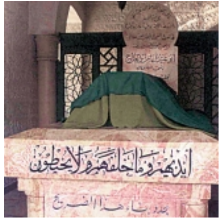
ضريح الصحابي الجليل أبو عبيدة The mausoleum of Abu-Aubaidah

وآخر تجديد للمقام في عصر المماليك. وهو مبني من حجارة قديمة ونقوش اسلامية. يعلو المبنى عدد من القباب تظهر عليها الصيانة غير المنسقة. وضريح يوشع من الداخل طوله أكثر من 6 أمتار مغطى