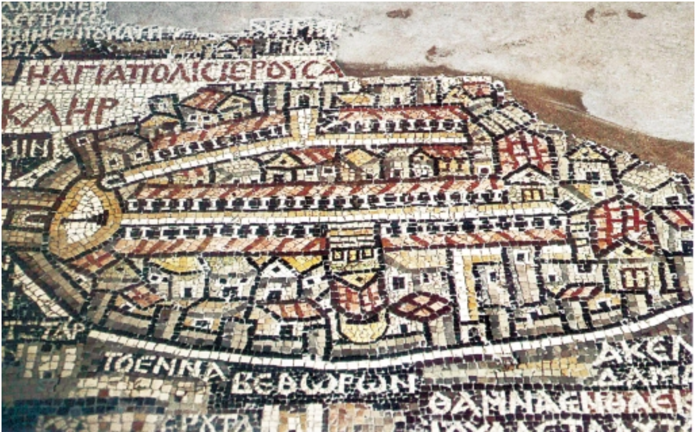
The Mosaic Map of Madaba

للنبي شعيب (ع) أكثر من موقع و مقام في أرض الأردن المباركة. فمقامه يقع على بعد 15كم جنوب شرق مدينة السلط 40كم من عمان في واد يسمى باسمه.