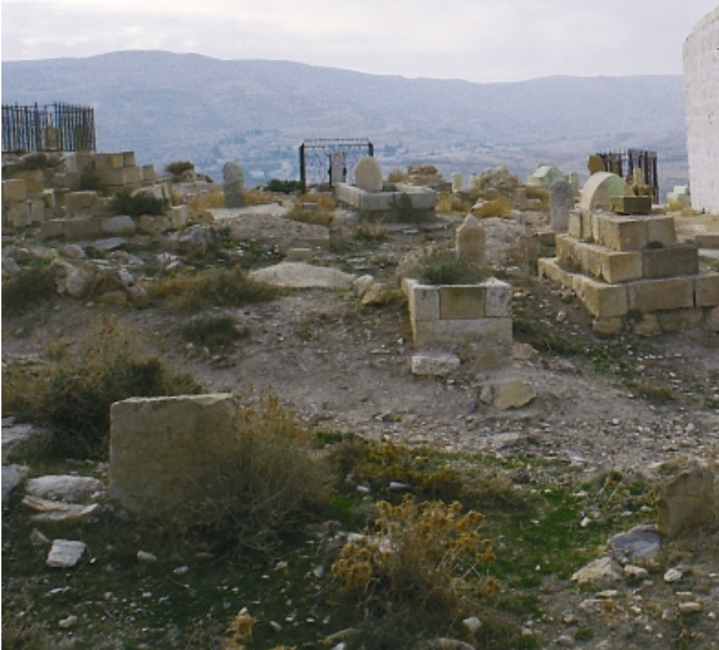
ضريح النبي نوح The Mausoleum of Prophet Noah

على بعد 32 كم جنوب غرب مدينة - الفسيفساء - مادبا تقع قلعة مكاور التي بنيت سنة 90 قبل الميلاد لتكون حصناً منيعاً لصد غزو الانباط العرب وترتفع حوالي 730 م عن سطح البحر. ومن هذا الموقع يمكن مشاهدة منظر رائع للبحر الميت وتلال وسط فلسطين والجبال الممتدة بإجاء القدس الشريف. اتخذها هيرودس بداية القرن الأول للميلاد قصراً للإستجمام و الراحة. وتعود شهرة هذه القلعة إلى