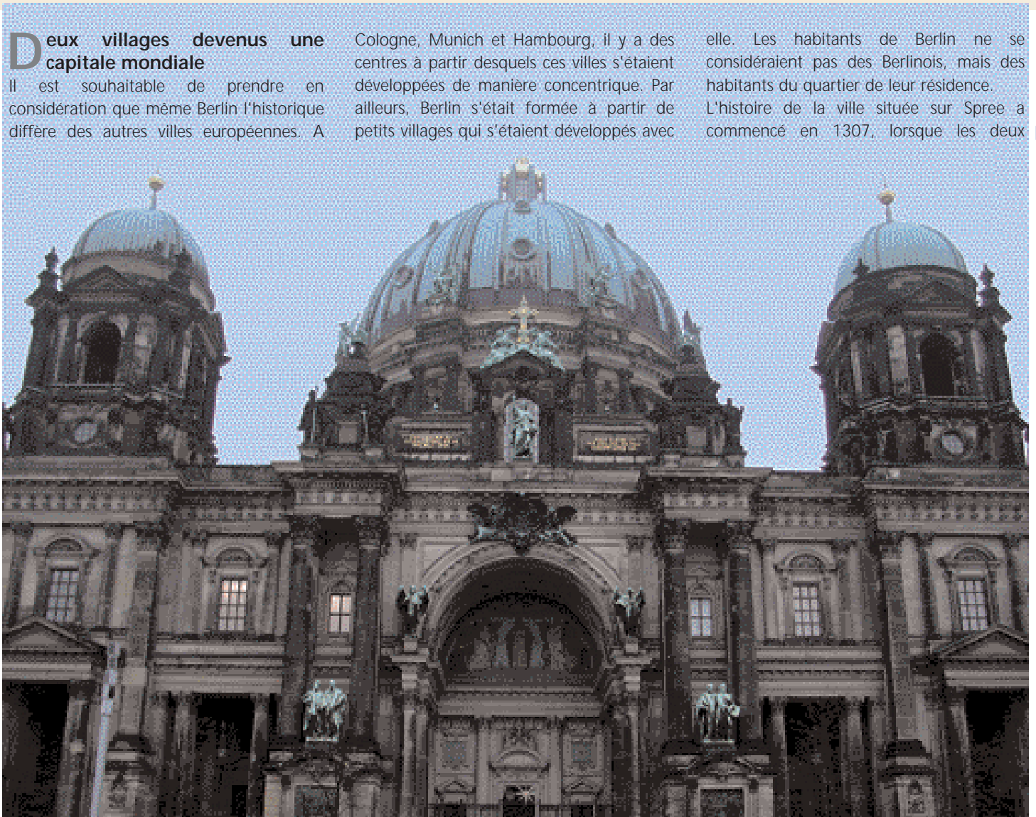
Dôme du Berliner

elle. Les habitants de Berlin ne se considéraient pas des Berlinois, mais des habitants du quartier de leur résidence. L'histoire de la ville située sur Spree a commencé en 1307, lorsque les deux