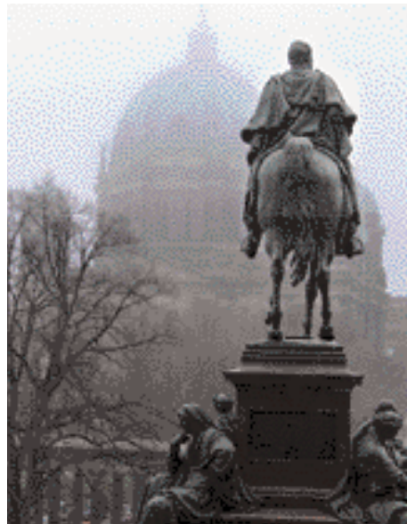
Statue de Friedrich Wilhelm IV