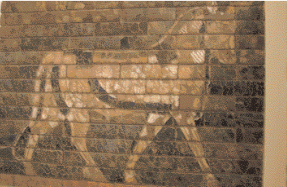
Porte d'Ishtar de Babylone