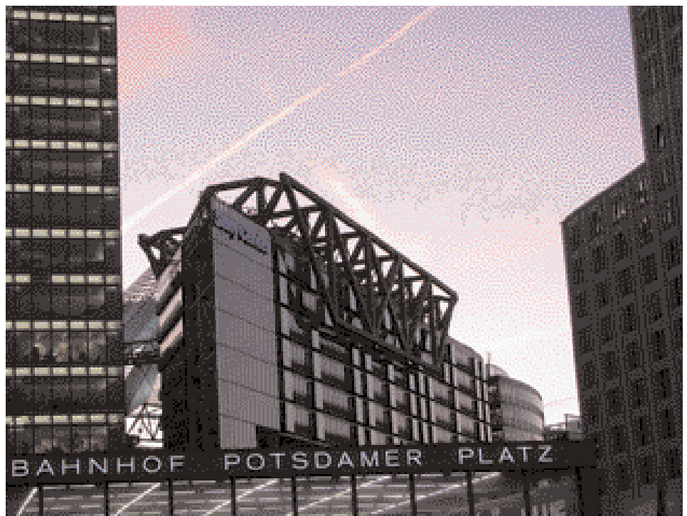
La nouvelle place Potsdam

En 2009, une collection du musée égyptien, des papyrus, la célèbre statue de Néfertiti et les œuvres de l'ère du pharaon Akhenaton