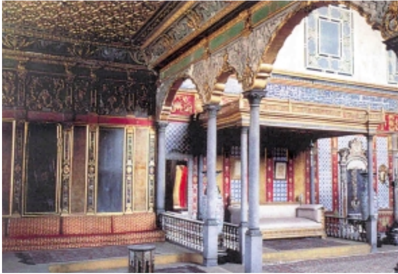
أحد قصور تركيا من الداخل Inside a palace in Turkey

وعدد كبير من الخطوط الدولية التي تسير رحلات منتظمة الى تركيا. ومن التجارب الشخصية التي اود نقلها للقراء الاعزاء هي رحلة برية قمت بها مع عائلتي في العام الماضي حيث غادرت الأردن بطريقي الى تركيا ومرورا بالمدن السورية في الشمال وصلنا الى الحدود التركية حيث قمنا باجراءات بسيطة جدا منها عمل بوليصة تأمين واطهار رخصة السيارة ودفع مبالغ رمزية ومقابل وصولات رسمية يمكنك الدخول بسيارتك والاستمتاع بتركيا.