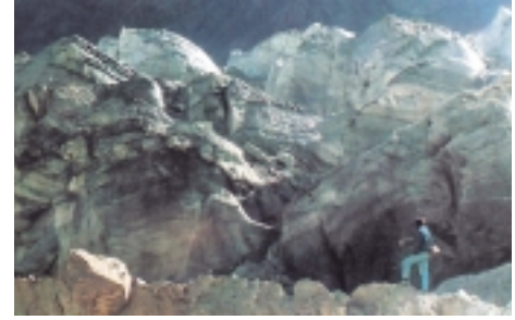
نهر هسبار الجليدي، وادي نجار Hispar Glacier, Nagar Valley

أما المناطق الشمالية، فقبل إستقلال باكستان كان الدخول إليها من سرينجار في وادي كشمير. وكانت رحلة المستكشفين السابقين تستغرق عدة أيام من