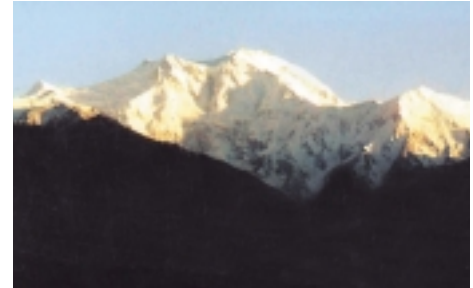
ننجا باربت كما تشاهد من التفرير Nanga Parbat, as seen from Fairy Meadows

الميناء الهندي ليومياً للوصول إلى سرينجار، وتأخذ 40 يوماً كحدّ أدنى للوصول إلى الأجزاء العليا لجليد بولترا والمناطق الأخرى. وبعد إستقلال باكستان، تحسّن الوضع، فقد افتتح في باديء الأمر مطار في سكارو، ولاحقاً ربطت بطريق لسيارات الجيب مع راوليندي، من خلال وادي شيلاز وكجن في منتصف الخمسينات. وتم بناء طريق سريع على طول طريق الحرير القديم، وذلك بمساعدة الصين في 1978. وهو يربط إسلام آباد وجلكت.