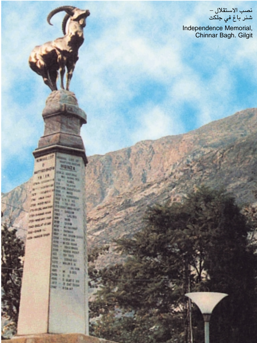
نصب الاستقلال - شتر باغ في جلكت Independence Memorial, Chinnar Bagh, Gilgit

الرياح الموسمية المنطقه في فصل الصيف، ومتأخراً. بدأ البعض بالتسلق شتاءً أيضاً.