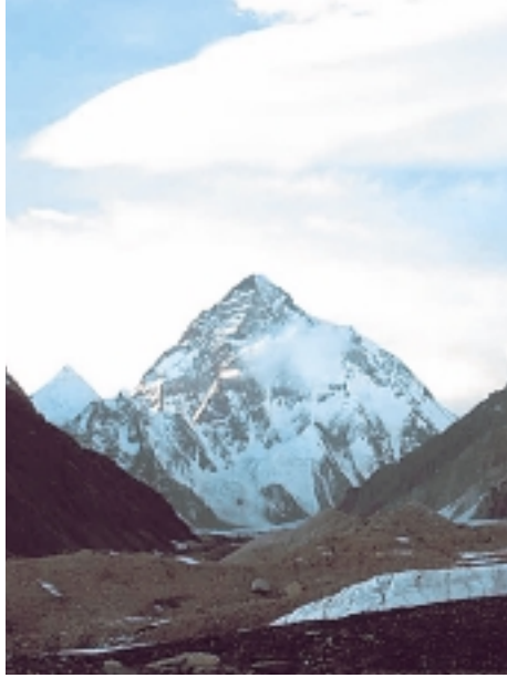
قمة K-2، ثاني أعلى قمة في العالم K - 2 The Second Highest Peak in the World

قره قورم "نهر هندو". أعلى قمة في هندوكش هي "تريش مير" (7708 أمتار). وقمم أخرى تتضمن "أسترا أو نال" (7403 أمتار). "ساراجار" (7349 متراً). "نوشاك" (7492 متراً). "درين زوم" (7219 متراً) و"شينجيك زوم". وتتولد بضعة أنهار من ذوبان الجليد في سلسلة الجبال.