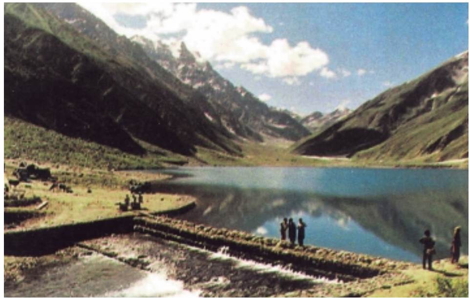
Lake Saiful Muluk, Kaghan Valley