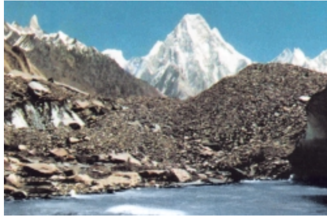
قمة جاشير برم الرابع، جبال قره قورم Gasherbrum IV, Karakoram Range

هملايا الغربية تقع بين "وادي كشمير" في الشرق و"نهر أندوز" في الشمال والغرب. وتطل عليها سلسلة جبال "نجا باربت" ذات القمّة الأعلى التي ترتفع 8125 متراً. وهي تشمل مناطق "كشمير"، "كاجان"، "كوهستان"، "دوسال" و"شيلاس". وتطل هذه السلسلة أيضاً على سهول "دوساي" التي تقع على ارتفاع أكثر من 4500 متر والذي يملئ بالزهور في شهور الصيف فيزهو بمنظر رائع الجمال. تصل ←