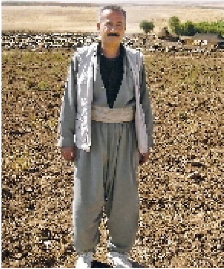
Berger de la région Harer راعي من منطقة حرير

plus beaux sites touristiques de l'Irak. C'est l'une des rares régions dans le monde à disposer de tous les fondements du tourisme: beauté de la nature, montagnes envoûtantes, température modérée (notamment en été), la neige recouvrant ses sommets montagneux, dont certains de manière permanente, tel le sommet de Sri Hassan Bik et la chaîne de Hasarost. Quant on se promène au centre de la ville, on est saisi par la vaste renaissance urbanistique qui vise à sa restauration pour qu'elle puisse accueillir ses visiteurs. Toutefois, le plus saisissant dans cette ville ancestrale est sa forteresse historique, qui est visible de tous les coins de la ville et attire ainsi les visiteurs d'Arbil.