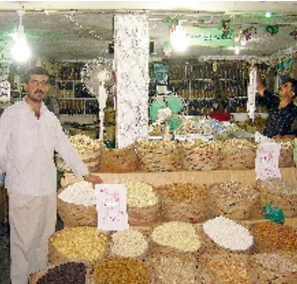
Boutique de fruits secs محل بيع المكسرات

les moyens de loisirs, d'hôtels, de restaurants... D'ailleurs, le gouverneur du Kurdistan y a élu sa résidence.