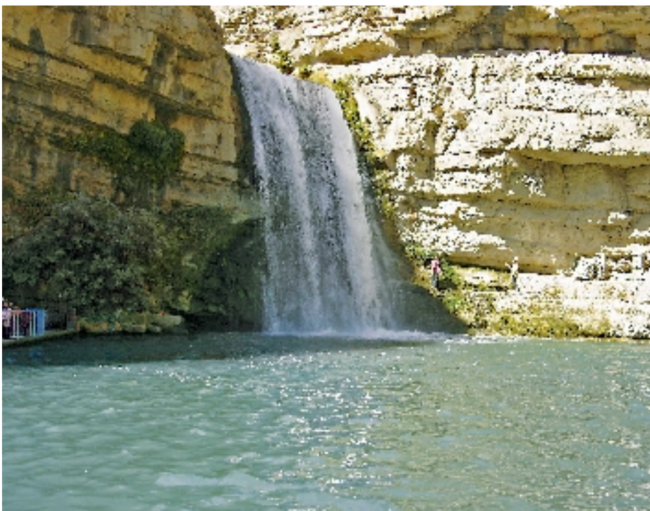
Cascade de Kali Ali Bek

Aujourd'hui, Arbil est l'une des plus importantes provinces du Kurdistan et l'un des