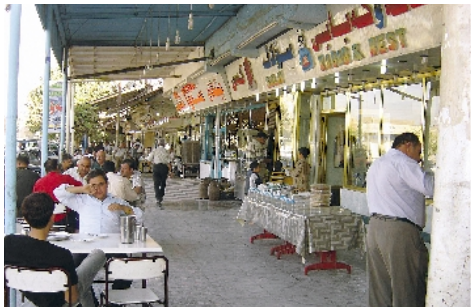
Restaurants d'Irbil مطاعم أربيل

un institut de tourisme qui a pour mission de former des cadres spécialisés dans l'administration des différents secteurs touristiques de la région. Un autre institut similaire a été créé à Dahouk.