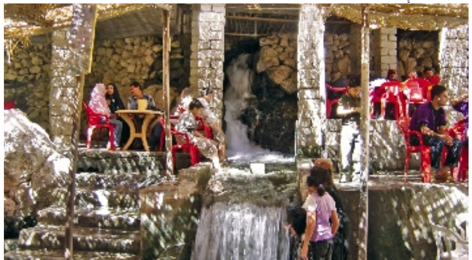
Chutes de Bikhal