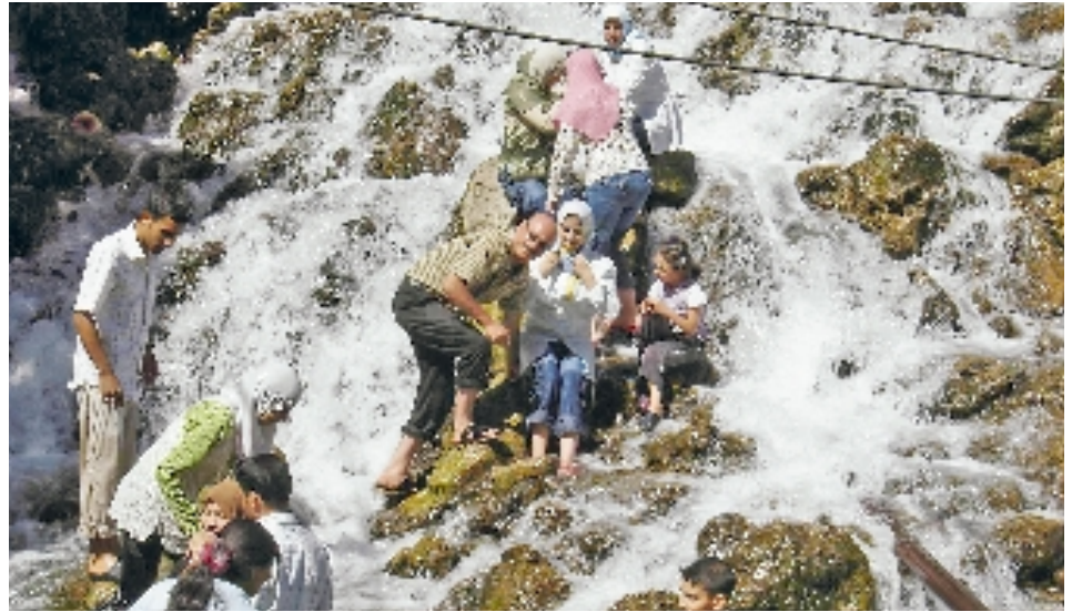
Chutes de Bikhal

Cette station est la plus proche d'Arbil, soit à 32 km, sur la route menant au mont Birmam, haut de 1090 m, et après avoir dépassé une route sinueuse avec 14 virages. Elle est située au sommet de ce mont, où la température maximale atteint 36°, et s'étend sur un vaste espace englobant la plaine menant vers la plaine d'Arbil et le mont Safine. Elle se caractérise par une abondante forêt de chênes verts et de peupliers, ainsi que par son air frais et pur. La station Salah-eddine dispose de tous ▶