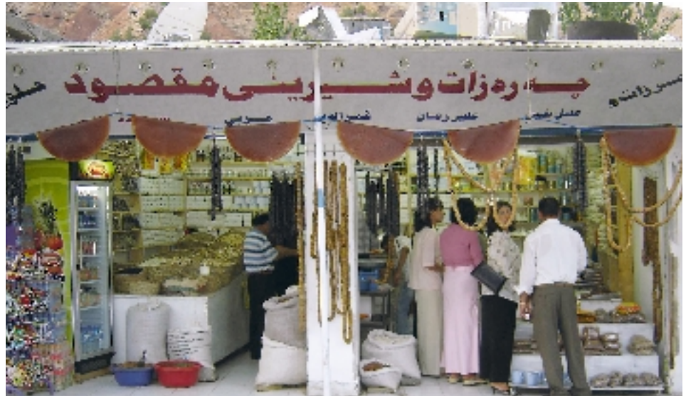
Boutique de fruits secs محلات بيع المكسرات التي تشتهر بها شقلاوة

Vu l'importance de cette station, on y a créé