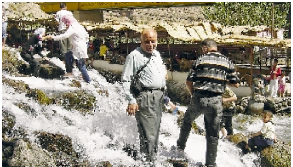
L'auteur devant les chutes de Bikhal