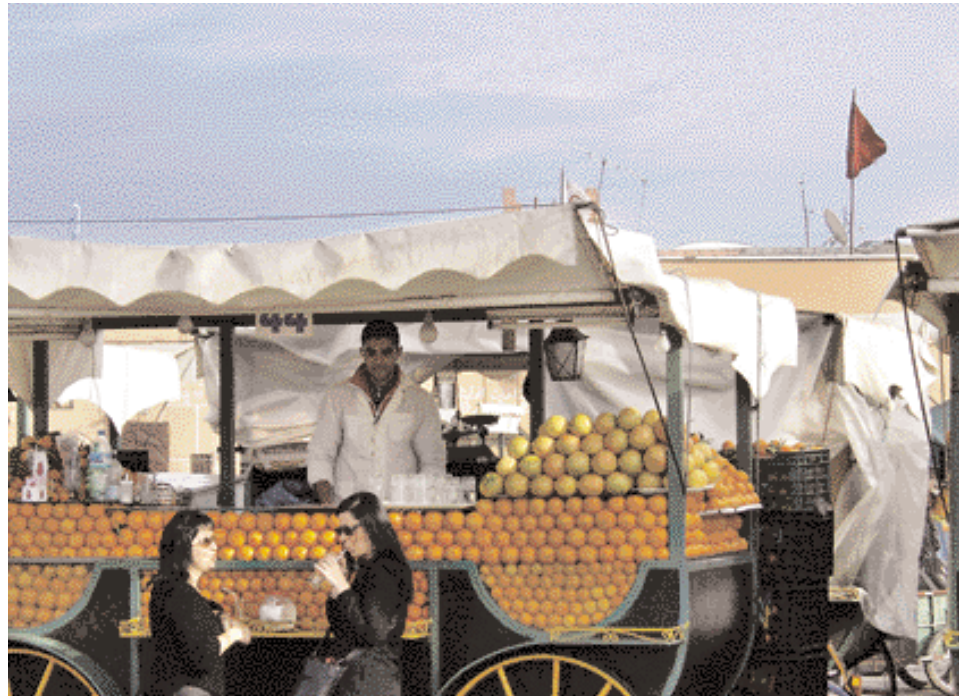
Jus d'orange frais