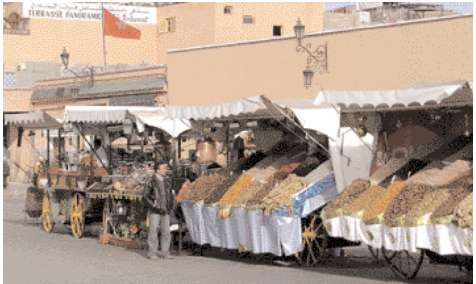
Boutique de dattes au souk

De nombreux historiens prétendent que le terme «marché», utilisé par toutes les langues européennes provient du souk de Marrakech, et que cette forme de commerce est arrivée en Europe par le biais de l'Espagne. Lorsqu'on entre pour la première fois dans un souk, on y voit des labyrinthes. Mais, après quelques heures, on y découvre la logique et les indications d'orientation. De nombreux artisans offrent aujourd'hui leurs articles aux