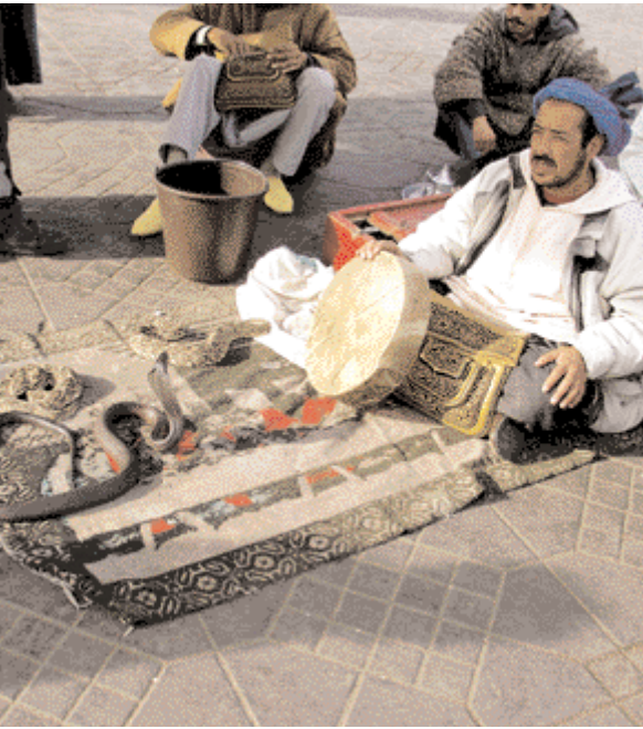
الحاوي في ساحة جامع الفنا Charmeur de serpent à Jamaa El Fna