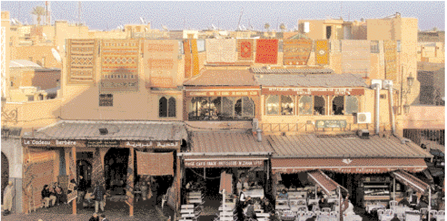
Après-midi au coeur de Marrakech