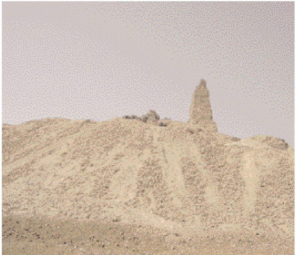
Ruines du palais de Nemrod

A gauche du hall, on trouve le rocher sur lequel fut déposé le père des prophètes à sa naissance. Rocher de couleur jaunâtre, comportant deux trous où il y a de l'eau, et d'où émanait un air parfumé; qui malheureusement a disparu de nos jours. Ce rocher comporte deux autres trous, dont on ne sait pas s'il en jaillissait de l'eau et a une forme ovale. La grille qui entoure ce rocher est recouverte de l'intérieur de métal luisant, et de l'extérieur de bois noble, au-dessus duquel il y a un bel ornement métallique. A droite, on trouve une petite porte, où le visiteur (un seul) pénètre pour recevoir la bénédiction, en offrant quelques pièces. Au dessus, il y a un écriteau indiquant les démarches à suivre pour effectuer la visite. Tout près de là, un espace est recouvert de tapis, où ▶