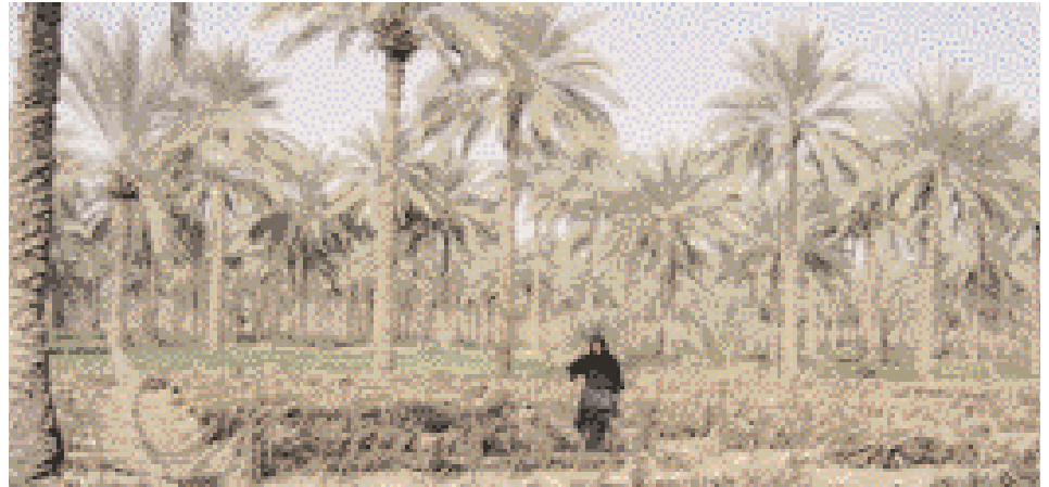
Zone près du brûloir

Ce qui est peut-être étrange dans ce lieu, c'est que certaines briques qui avaient servies pour sa construction sont restées bien conservées. De même, de nombreux trous sont visibles sur cette tour, dont on ignore les causes