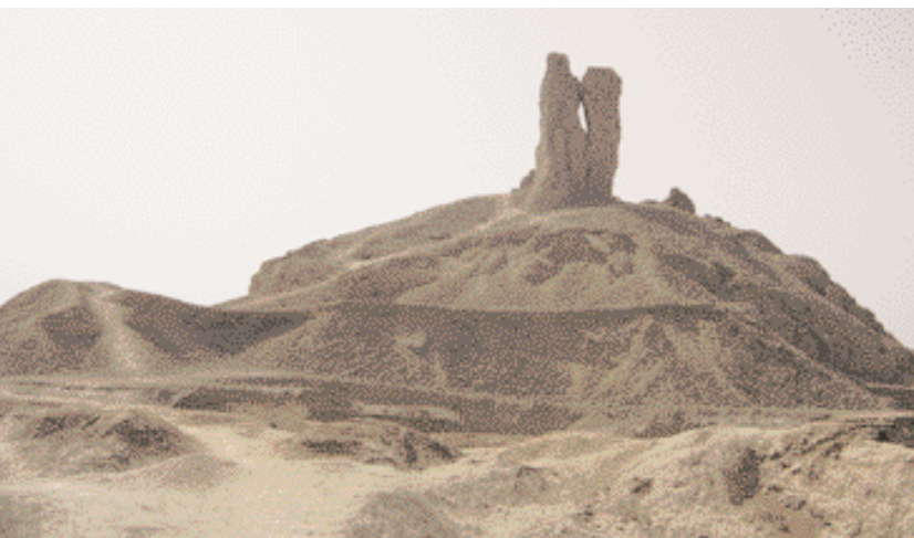
Ruines du palais de Nemrod et La Tour

Ce lieu saint et les sites patrimoniaux environnants méritent davantage d'intérêt et une considération qui soient au niveau de la sainteté de ce lieu de naissance, de l'importance historique de Azzaqoura et Mehraka et de la place du père des Prophètes, Abraham El Khalil (SL). ■