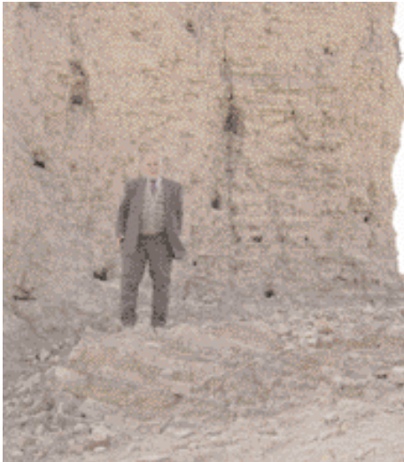
L'auteur près du palais de Nemrod الكاتب في قصر النمرود

travers une piste passant par une zone agricole. On entre au site par une porte en bois, au-dessus de laquelle, il y a un écriteau indiquant: "site où fut né le prophète Abraham (SL)". Puis, on se retrouve dans une esplanade de 50x50 m, entourée d'une haie d'une hauteur moyenne, et avec un sol recouvert de marbre. Au bout, une porte de bois donne accès à une petite allée qui mène à un vaste hall où s'effectue la prière, et comportant une bibliothèque contenant des Corans et des ouvrages d'implorations et des traditions des visites. Le conservateur de ce site, est installé dans un coin derrière une petite table. Chaque visiteur y dépose une pièce de monnaie et reçoit en contrepartie un bout d'étoffe verte comme bénédiction. Du côté droit de ce hall, il y a une échelle (à 18 marches) qui permet au visiteur de descendre à la grotte dans laquelle fut né Abraham (SL).