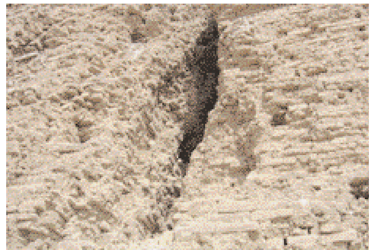
Ruines du palais de Nemrod