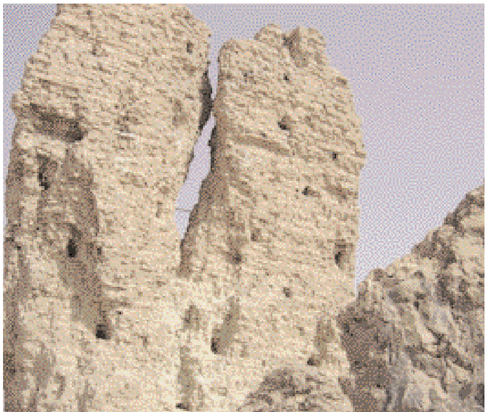
Ruines du palais de Nemrod