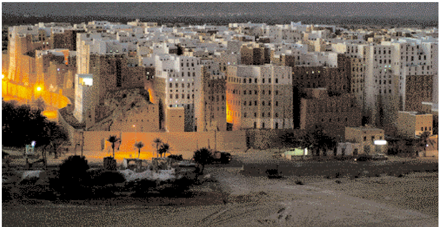
Vue de nuit