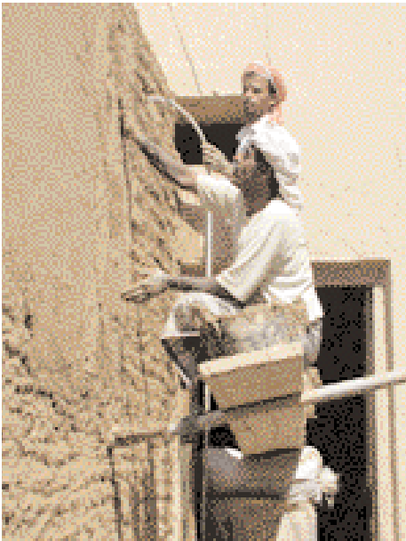
Opération de construction