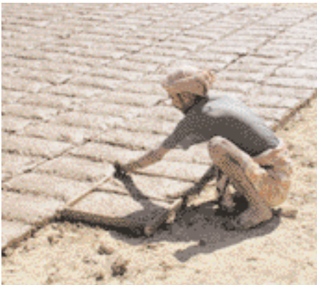
Fabrication de briques