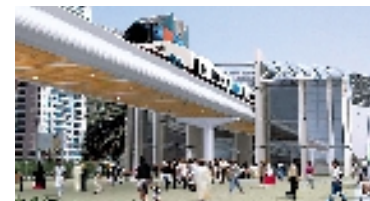
قطارات معائمة Trains aériens

et en encourageant leurs héros sur les pentes. N'importe qui dans le monde, ayant une idée difficilement réalisable, trouve des gens disposées à l'écouter dans cette ville du futur, dont les accomplissements ont souvent réussi à être retenus dans la collection 'Ripley, croire ou ne pas croire' des idées étranges. Sans doute, le parc de neige de Ski Dubai, développé par Investissements de Majid Al Futtaim, s'adapte bien au monde féérique de Dubaï. C'est le condensé de nombreux emplacements et activités passionnants, que les visiteurs trouveront dans cette ville où les rêves deviennent réalité.