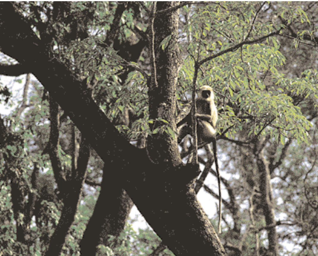
A Monkey from Kerala.