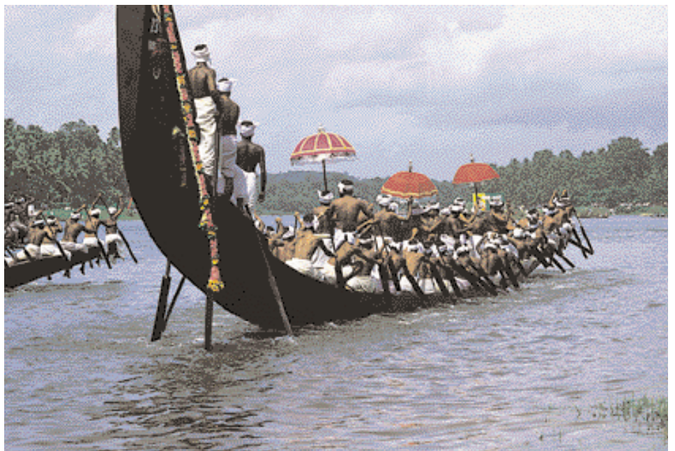
The boat race.