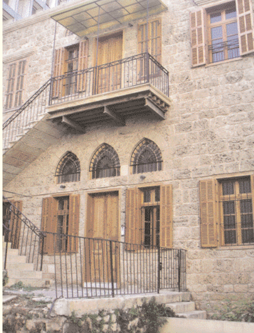
Renoviertes Gebäude in der Monot Street