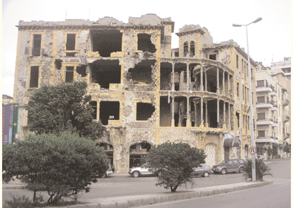
Monumente des Bürgerkriegs

Ich fasste den Entschluss Beirut auf der Suche nach seinen Architekturschätzen neu zu ergründen. Die Stadtverwaltung hatte einige Viertel mit dem Verweis auf ihr historisches Kulturerbe gekennzeichnet. Dazu gehören die Viertel Yasouiyeh, Patriarchat und Sanayeh. Insgesamt findet man einzelne wunderschöne Elemente des Beiruter Architekturstils über die ganze Stadt verstreut. Vor allem die Viertel: Ashrafyeh, Ras el Nabeh, Ras Beirut and Jimmayzeh sind sehenswert. Die Gebäude lassen sich in drei Gruppen einteilen. Zur ersten Gruppe zählen die bereits restaurierten Gebäude. Herausragende Beispiele befinden sich in den Straßen von Monot, Spears und Abdel Wahab el Inglizi. Vereinzelt können auch Gebäude in Minet el Hosn and Zokak el Blatt entdeckt werden. Viele sind als Wohngebäude, andere als Restaurants, Galerien und Büros genutzt. Die zweite Gruppe besteht aus unbewohnten Gebäuden, die eine unverzügliche und umfassende Instandsetzung benötigen. Ungeklärte Eigentumsfragen und finanzielle Gegebenheiten verhindern unter anderem geeignete Sanierungspläne. Zum Teil zerstörte und stark beschädigte, leer stehende Gebäude fallen unter die dritte Gruppe. Um sie nutzbar zu machen, bedarf es massiver Investitionen und der Zusammenarbeit von privatem und öffentlichen Sektor unter der Hilfe von qualifizierten Restaurateuren und Architekten. Die Gebäude der zweiten und dritten Gruppe sind über das gesamte Gebiet der oben genannten Viertel verteilt. Seltene Beispiele der Interpretation des