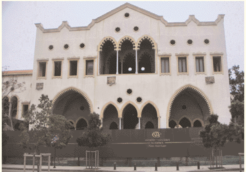
Das Architekturerbe erhalten