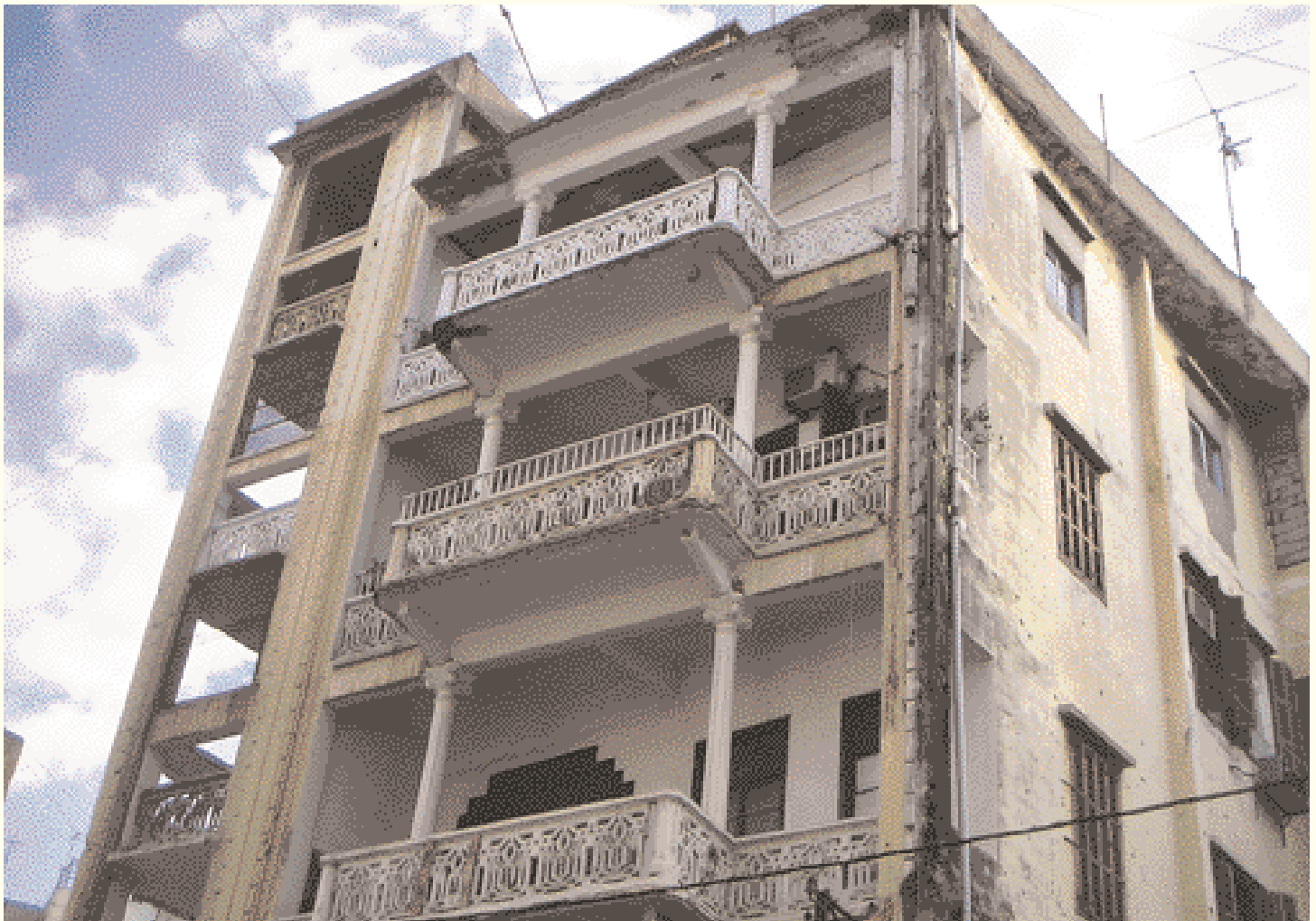
Unbewohntes Gebäude mit riesigen Veranden

Arabisch-islamische Architektur ist wahrlich reich an Stilen, Formen und Techniken. Die regionale Architektur und ihre Baumaterialien wurden an die gegebene Umwelt, die klimatischen und kulturellen Verhältnisse und die verschiedenen Lebensstile angepasst. Die "Wolkenkratzer" von Shibam im Jemen, das "Damaszener Haus", die Fensterbalkone aus Holz in Ägypten ("Maschrabijah") und die "Windtürme" im mauretanischen Stil verdeutlichen die architektonische Spannweite. Vom spanischen Andalusien über die zentralasiatischen Städte von Samarkand und Bukhara bis hin zu Marrakesch, Kairo, Damaskus, Istanbul, Jerusalem, Sana und Isfahan: Hunderte Städte, tausende Moscheen und zehntausende öffentliche und private Gebäude bestätigen die Schönheit und Vielfalt der lokalen 'Settings'.