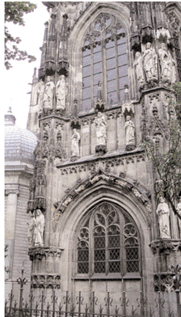
Le chœur de l'extérieur

La fontaine d'Elise et les bains du style de l'art Déco sont des symboles, du fait que les sources curatives n'ont jamais perdu leur attraction au cours des années. Aix-la-