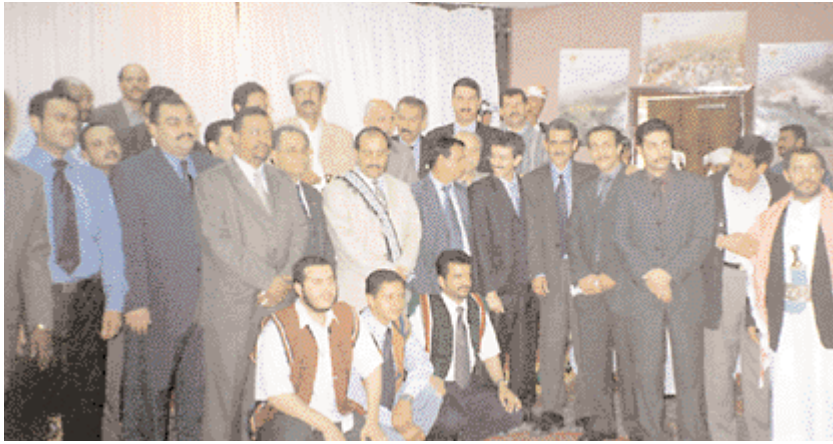
صورة تذكارية خلال افتتاح المعرض مع السيد خالد الرويشان وزير الثقافة والسياحة.

The exhibitors with the Minister of Culture and Tourism, Mr Khalid al-Ruwishan.