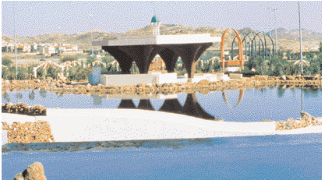
حديقة الملك فهد في الطائف King Fahd Park in Ta'if

The projects that were opened by the Crown Prince will contribute to promoting the tourism and service sectors of the city of al-Ta'if, which during the last two years has witnessed the setting up of a tourist and service infrastructure benefiting from a moderate climate and beautiful natural scenery.