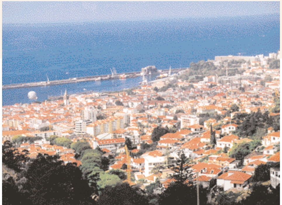
Vue de Funchal et de la mer منظر لفونشال والبحر

Les deux sont réellement le cœur central d'un groupe de quatre îles de l'Océan Atlantique qui compose la terre presque mythique de Macaronésie. C'est ce que j'ai appris en faisant un peu de recherche pour cet article. On le trouve inscrit juste avant le mot "macaronis" dans Wikipédia, la plus grande encyclopédie en ligne du monde.