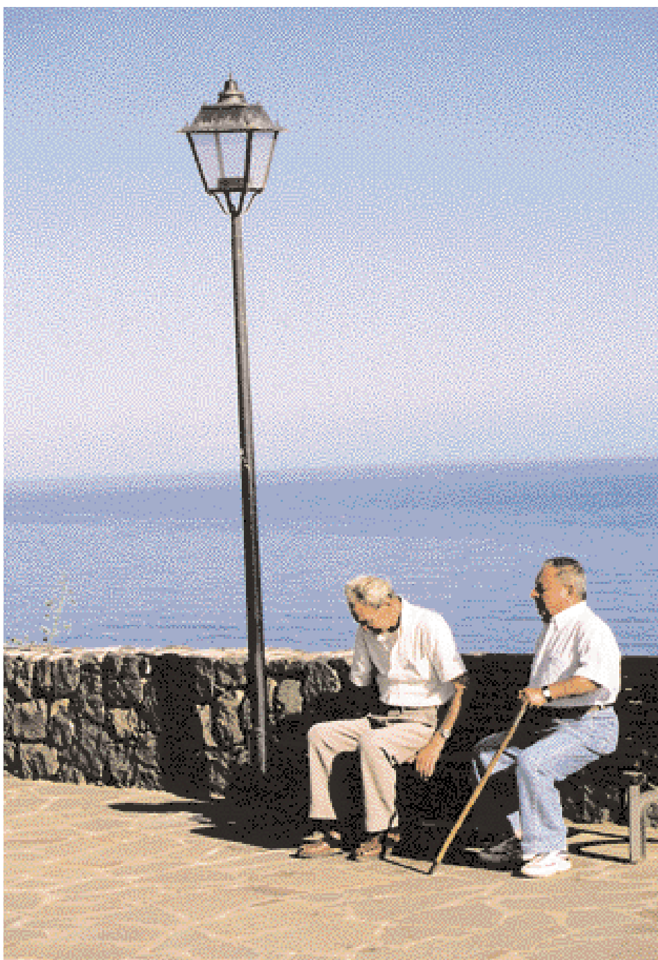
Deux hommes contemplant Tenerife