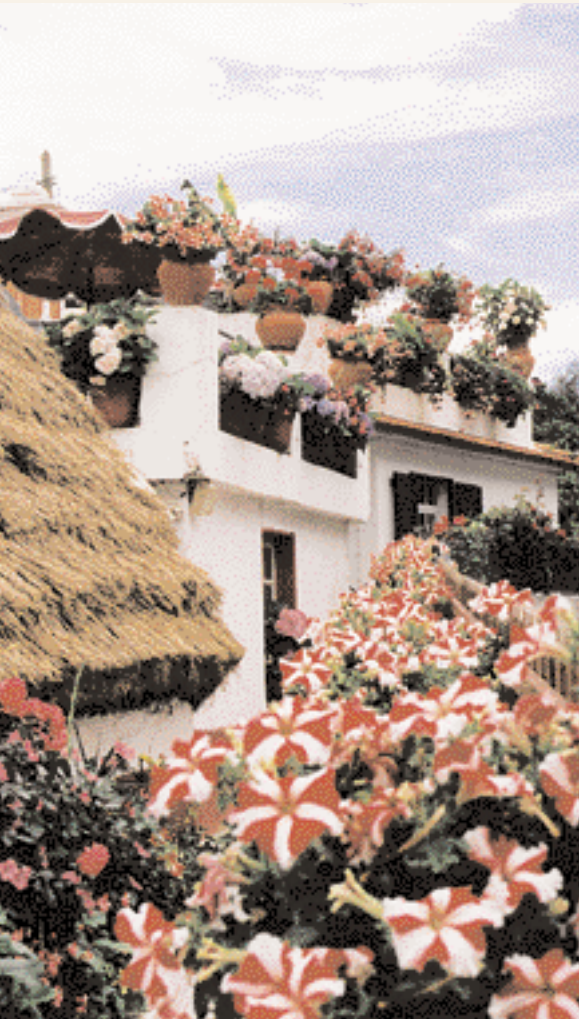
Maison recouverte de fleurs à Funchal بيت مغطى بالورود في فونشال