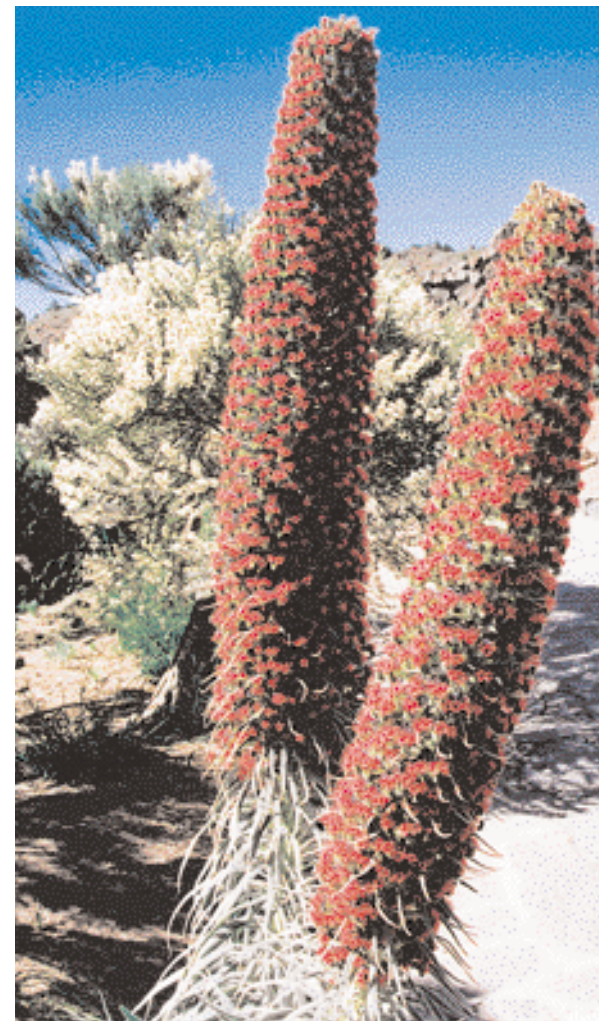
Etranges plantes volcaniques à Tenerife نباتات بركانية غريبة في تاناريف

d'osier avec les coureurs en bois et chacun peut porter deux personnes. Des hommes qui portent des chapeaux de paille anciens dirigent et contrôlent les toboggans. Une promenade de 20 minutes vers le bas coûte approximativement 15$ par personne. Prenant son nom de la plus grande île du groupe où Funchal est localisée, l'archipel de Madère inclut aussi l'île Porto Santo qui est ensoleillée et a une mer avec des vagues et deux autres îles habitées seulement par les otaries et les oiseaux de mer.