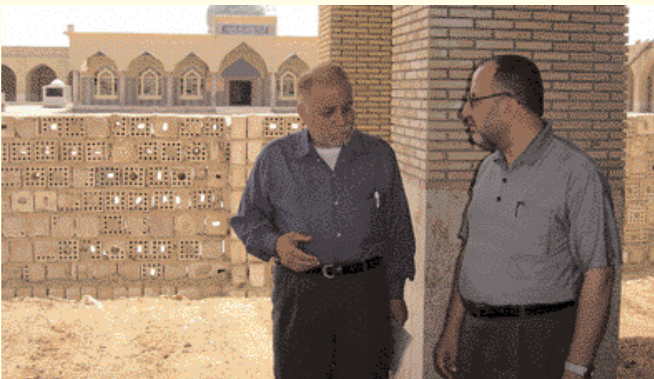
Le représentant du magazine parlant avec l'ingénieur responsable de la reconstruction

مندوب المجلة يتحدث مع المهندس المشرف على عملية الاعمار