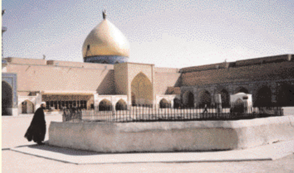
Lieu où l'on croie que l'Arche de Noé fut amarré après le Déluge

A deux kilomètres environ au nord de la mosquée Koufa, se trouve la mosquée de Assahla, considérée comme la 5 ème mosquée de l'Islam, après celles de Al Haram, de Jérusalem, du Prophète et de Koufa. Des récits évoquent les bienfaits de cette mosquée qui aurait été visitée par de nombreux prophètes. Elle comporte 7 lieux saints. Celui du prophète Ibrahim, qui serait parti de cette région pour combattre les géants du Yémen. Le lieu saint du prophète Idriss (tailleur) qui aurait été emporté grâce à