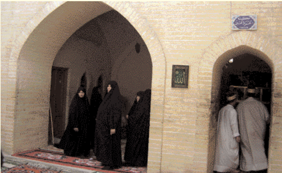
Librairie de Al Hassan et Al Hussein