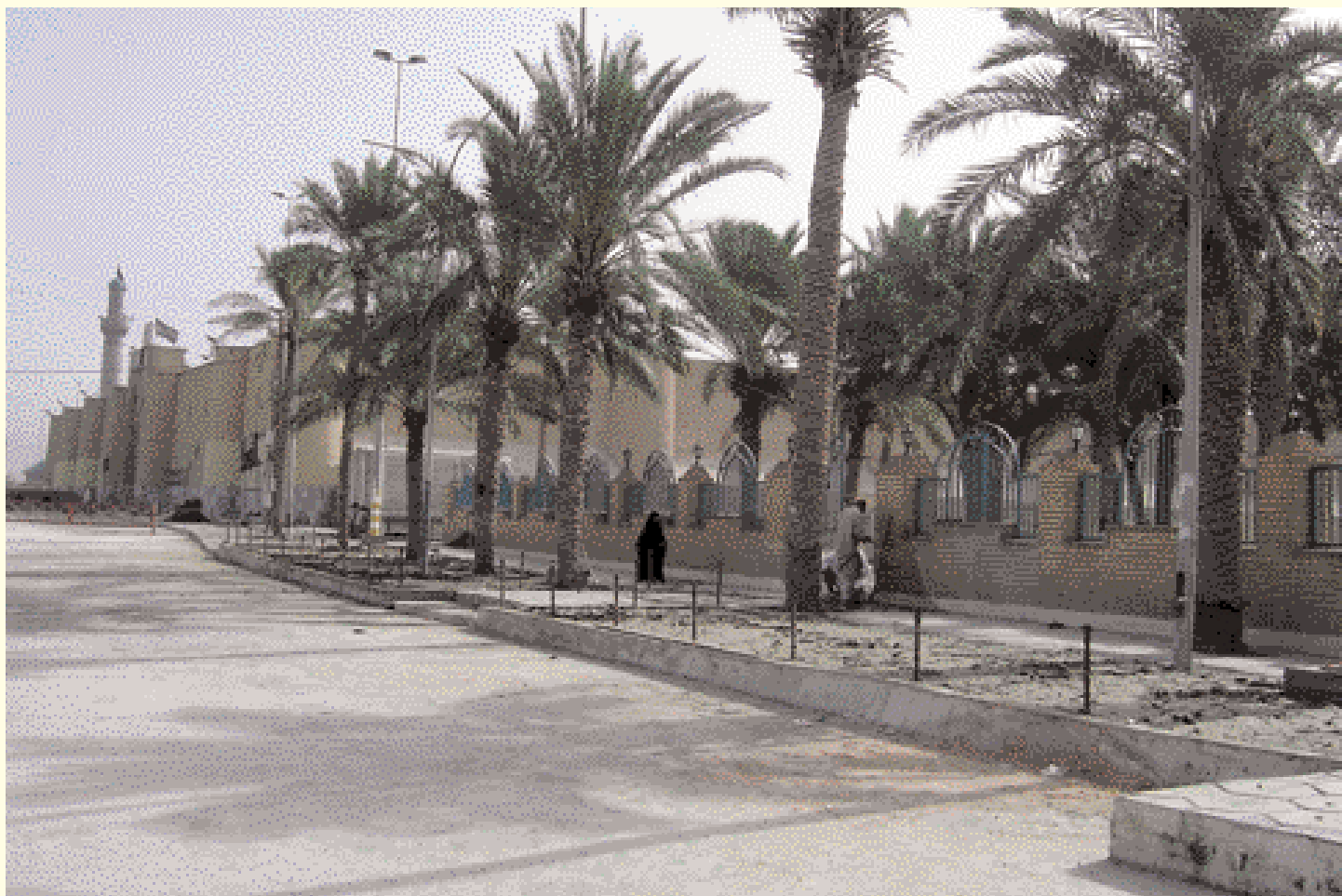
Place près du Mausolée de Moslim Ben Aqail

C'est le palais où résidaient les walis de Al Koufa. Il fut démoli en l'an 72 H sur ordre de Abdelmalek Ben Marwan; lors d'un célèbre événement historique. Sa longueur est de 33 m et l'épaisseur de ses murs atteignait 3,5 m. Il n'en reste que les fondations. Ses chambres nombreuses ne sont que des ruines. Outre l'habitat, ce palais fut utilisé pour se débarrasser des opposants. ➤