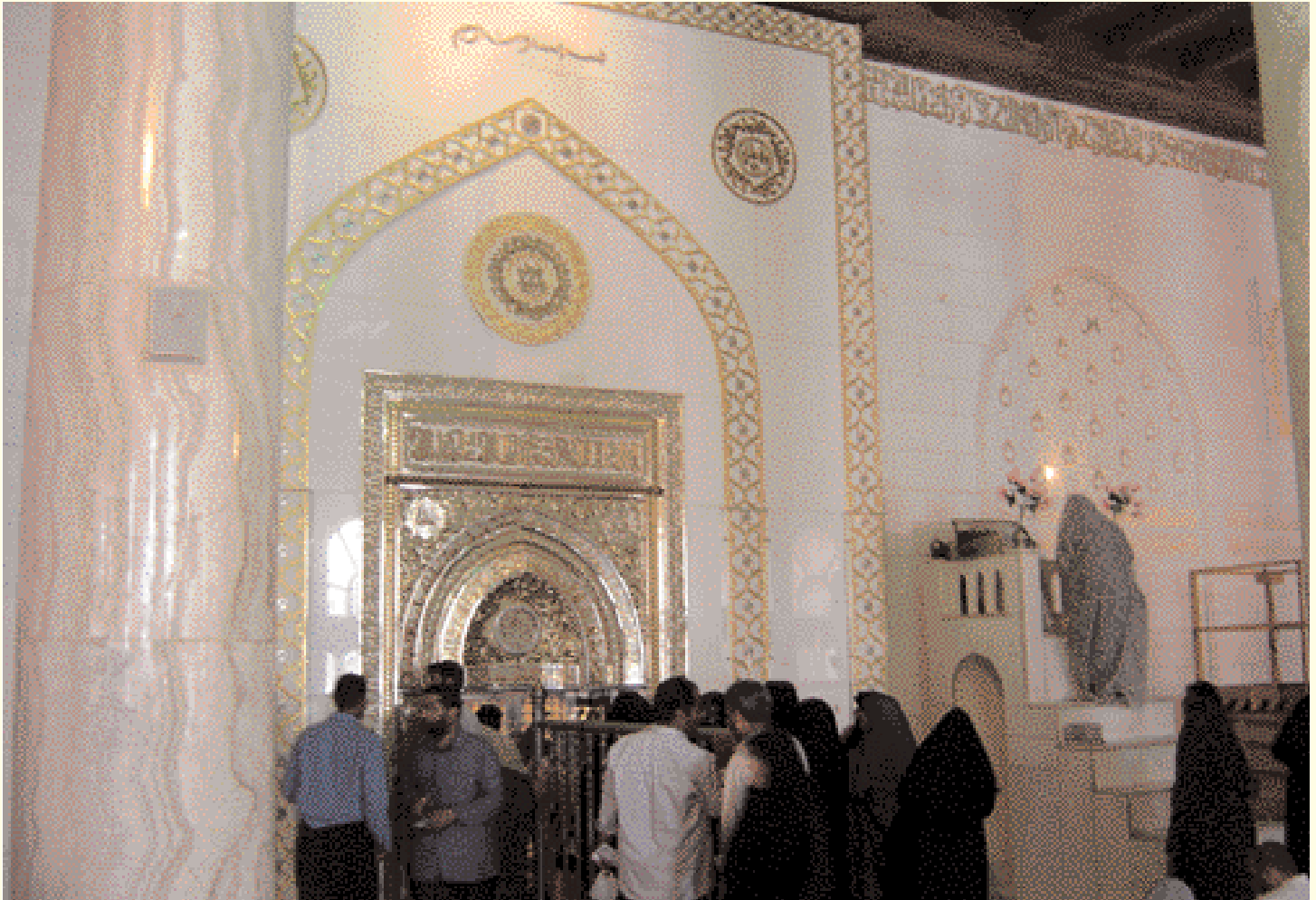
Minbar et Mihrab de l'Imam Ali après leur reconstruction

Walid Abdul-Amir Alwan