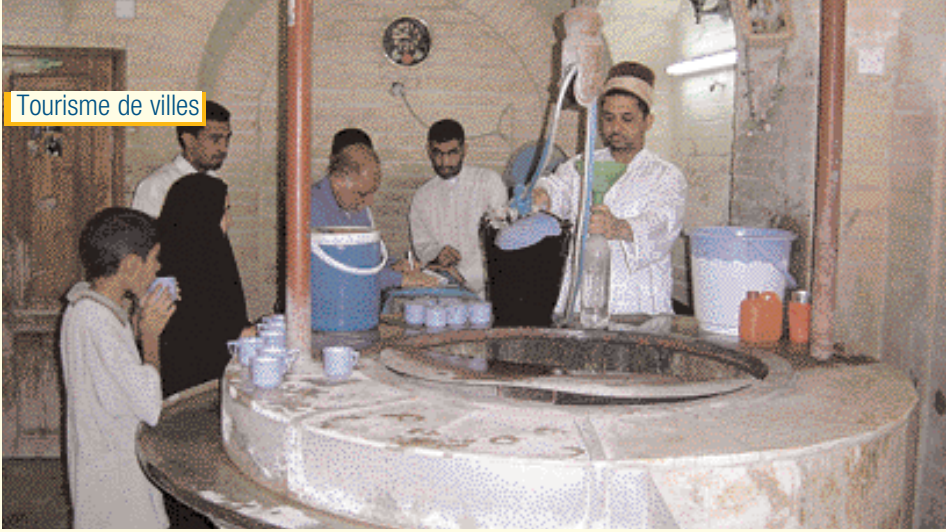
Puits de l'Imam Ali