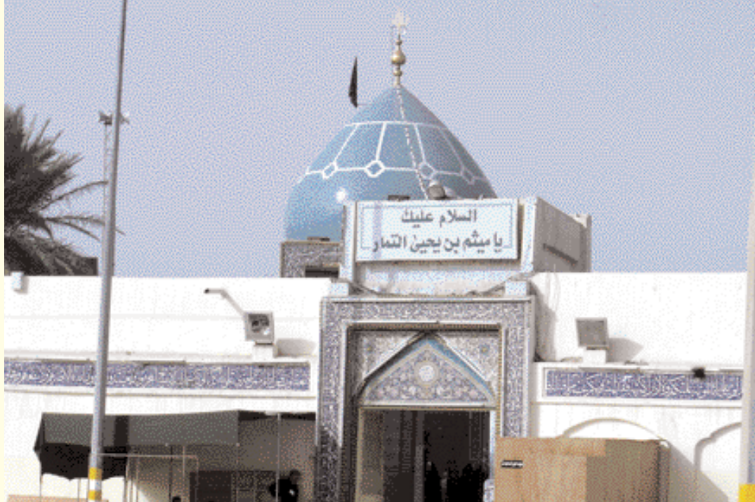
Mausolée de Maytham Attammar

La ville de Koufa est considérée comme l'une des plus importantes villes islamiques fondées dès le début de l'Etat Musulman, sous le règne du second khalife Omar Ben al Khattab. Elle fut construite en tant que garnison militaire, pour protéger Médine. Ses premières maisons furent construites en roseaux sur ordre de Saad Ben Abi Wakkass en l'an 17 de l'Hégire (H). Mais, après qu'elles aient été ravagées par le feu, elles furent reconstruites en briques sous le règne de Al-Moughira Ben Chaâba. Cette garnison fut divisée en sept zones, chacune réservée à une tribu et cela dura jusqu'au temps de l'Imam Ali, en l'an 36 de l'Hégire. Ce régime fut changé par le wali Ziad Ben Abih en l'an 50 H et remplacé par une division en 4 zones. L'importance de cette ville s'était accrue lorsque l'Imam Ali l'avait prise comme capitale de l'Etat musulman en l'an 36 H (657) avec l'appui de plusieurs Compagnons, après sa victoire dans la bataille du chameau. Ainsi, elle était devenue un centre de l'activité scientifique, grâce notamment à son rôle commercial et par sa position sur la route du Pèlerinage à La Mecque. Mais, avec l'avènement des Abbassides en l'an 132 H, la ville déclina, notamment avec la construction de Al-Hachimiya près d'elle et le transfert de la capitale à Bagdad en l'an 145 H. De nombreux hommes de sciences et de lettres