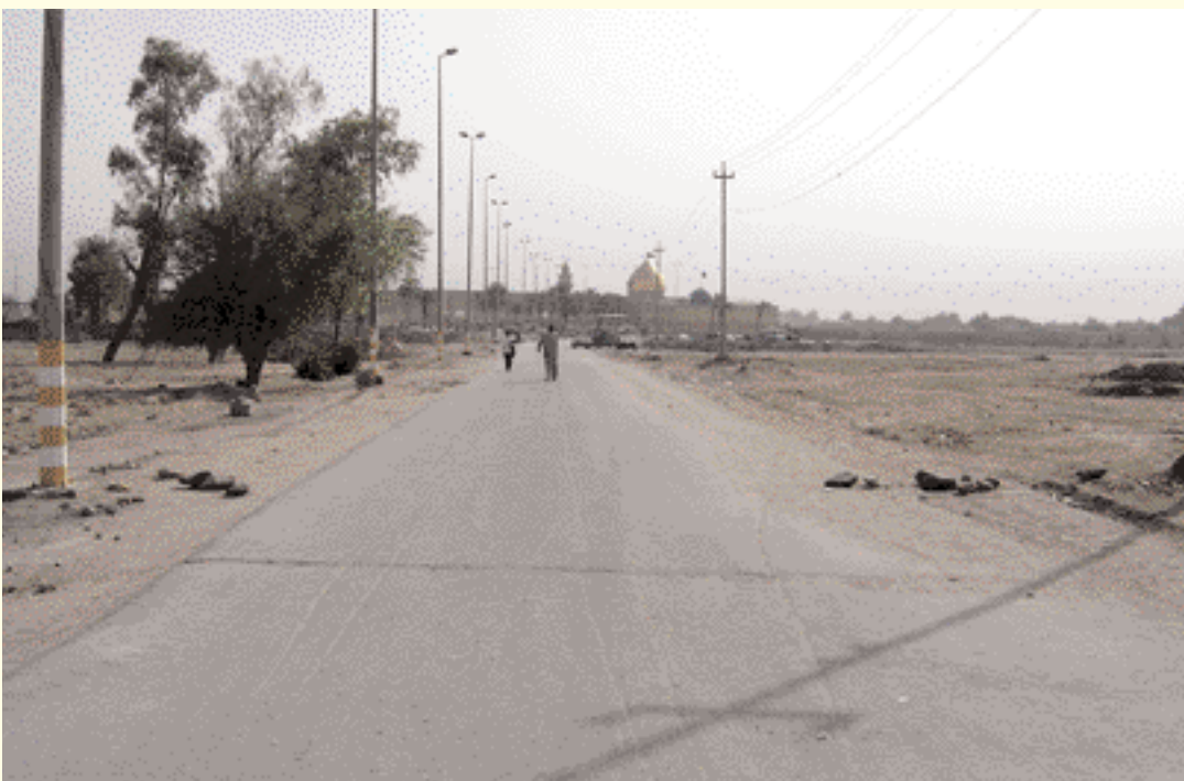
Mausolée de Moslim Ben Aqail