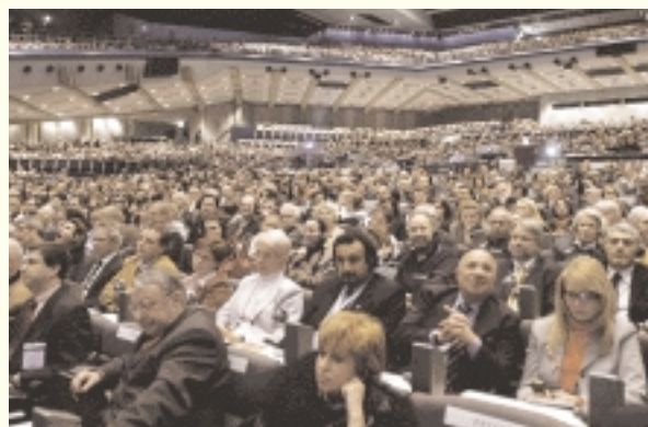
Large audience à la cérémonie d'inauguration

intéressants. Nous avons distribué notre magazine aux conférenciers, à l'audience et aux ministres de tourisme. ■