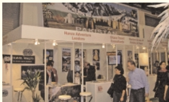
Stand du Pakistan