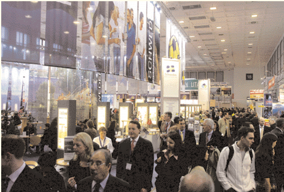
Grand intérêt des visiteurs

Pour son 40ème anniversaire, l'Exposition Internationale du Tourisme de Berlin (ITB) s'est tenue du 8 au 12 mars. La participation a atteint lors de cette édition un record: 183 pays et 10.856 exposants ont participé cette année à la plus grande foire du tourisme dans le monde.