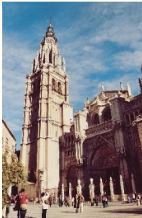
Cathédrale de Tolède

On accède à Tolède par sa porte arabe ancienne qui s'appelait Bab As-Sahl, actuellement nommée Puerte de Bisagra. C'est la porte principale de la ville, considérée comme le carrefour des routes qui y mènent et comme l'une des portes andalouses les plus anciennes. En 1550, le grand architecte Covarrubias y rajouta une grande façade en hommage au roi Carlos 1er. Au temps du roi Philippe II, la porte a été élargie et on y ajouta deux tours, et une devise avec un aigle à deux têtes sur sa façade. Non loin de Bab As-Sahl, vers l'est, se dresse une autre porte appelée Bab Ashams, Puerte del sol. Elle fut construite sous le règne de Al-Ma'moun Di Announ, le gouverneur de Tolède au début du 10ème siècle de l'Hégire. Cette porte est l'une des plus belles réalisations architecturales des arabes dans la ville. Les travaux de restauration ont permis sa préservation. Sur sa façade, on voit une grande arcade de la forme d'un fer à cheval, au-dessus duquel, il y a de multiples