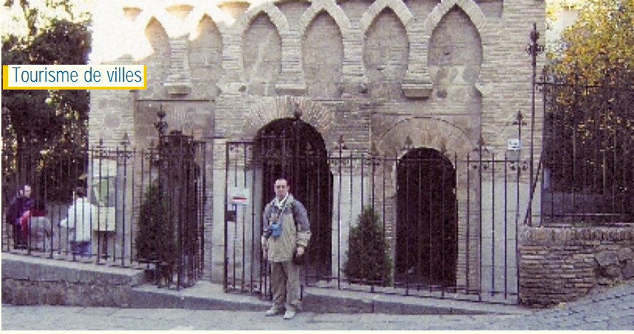
La Mosquée Bab Al-Mardoum, avec l'auteur