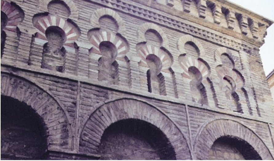
La Mosquée Bab Al-Mardoum