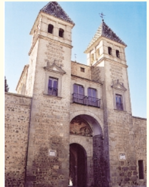
Porte de Bisagra