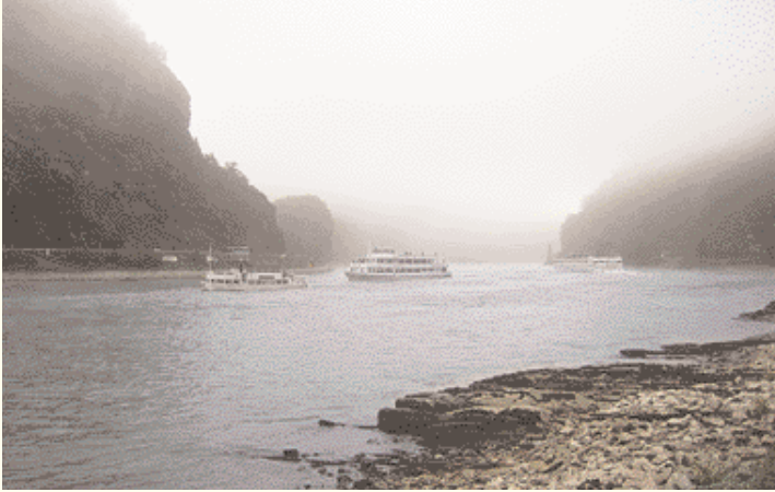
Loreley dans la brume