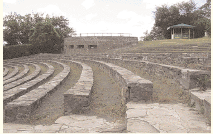
Théâtre de plein air à Loreley