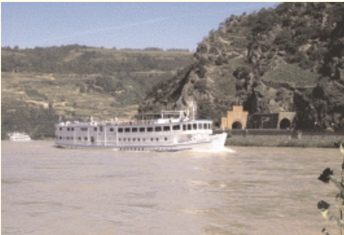
Promenade en vallée par bateau