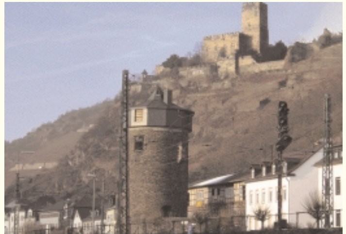
Hôtel et Forteresse au village de Kaub