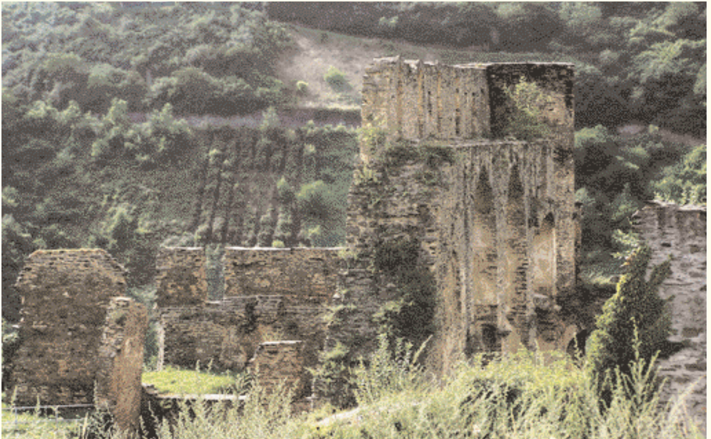
Forteresse de Rheinfels près de St. Goar

En 2002, la vallée entre les villes de Bingen et Koblenz par laquelle serpente la Rivière du Rhin, a été inscrite comme Site du Patrimoine Universel par l'UNESCO; en raison de son environnement unique dont la perte serait irremplaçable pour toute l'espèce humaine. Etant un des paysages naturels remarquables d'Allemagne, elle est une des destinations favorites pour les touristes. Aucune région ne comporte autant de châteaux et de forteresses médiévaux.