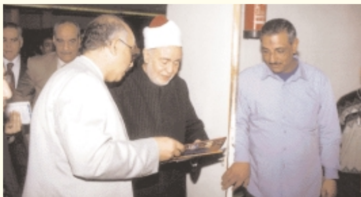
Dr. Tantaoui, l'Imam d'Al-Azhar, avec notre représentant

Le ministère du tourisme égyptien a organisé le mois précédent, en collaboration avec l'université Al Azhar, une conférence sur le thème : « le tourisme en Egypte d'un point de vue islamique et économique », en présence de l'Imam D. Mohamed Sayed Tantaoui, cheikh Al Azhar et de représentants du ministère du tourisme égyptien, à la salle des Congrès de ladite université. Ont participé à cette conférence de nombreux professeurs des universités Al Azhar, Alminyia et Al Fayoum, ainsi que des professionnels du tourisme, des journalistes et un public intéressé. Un grand nombre de recherches y ont été présentées traitant les aspects religieux, économiques et professionnels du tourisme en Egypte.