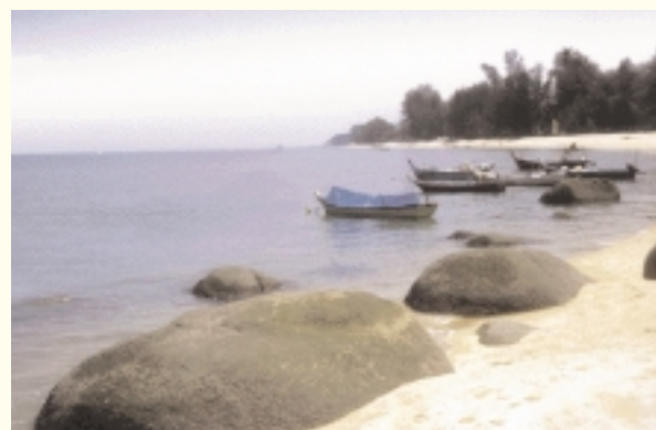
Plage de Ferringhi