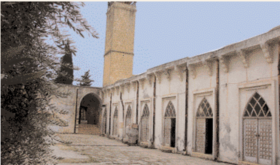
Die große Moschee von Sarmin

"Idleb ist ein Stück Himmel inmitten eines fruchtbaren Waldes." Mit diesen Worten beschrieb einst ein französischer Reisender die Provinz im Nordwesten Syriens, die an die Türkei grenzt und von Hama im Süden, Aleppo im Osten und Latakia im Westen eingegrenzt wird.