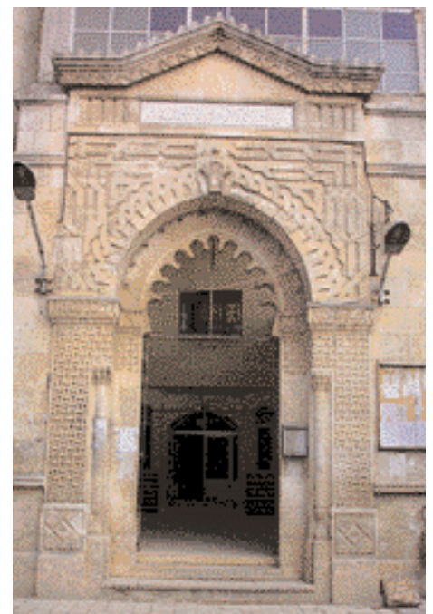
Die Große Moschee in Takharim

Idleb begrüßt jeden Besucher mit Liebe. Das saftige Grün ist seine Visitenkarte. ■