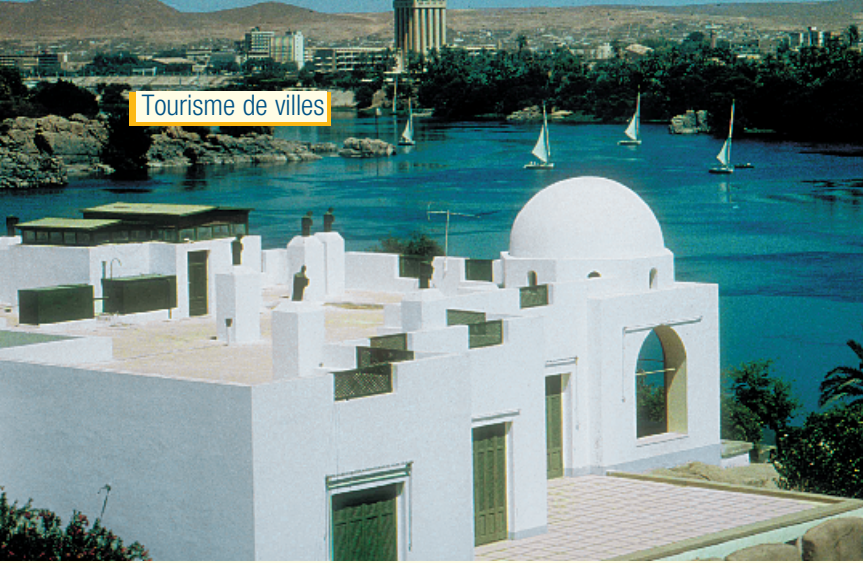
Villa de Beghum Kahn et le Nile