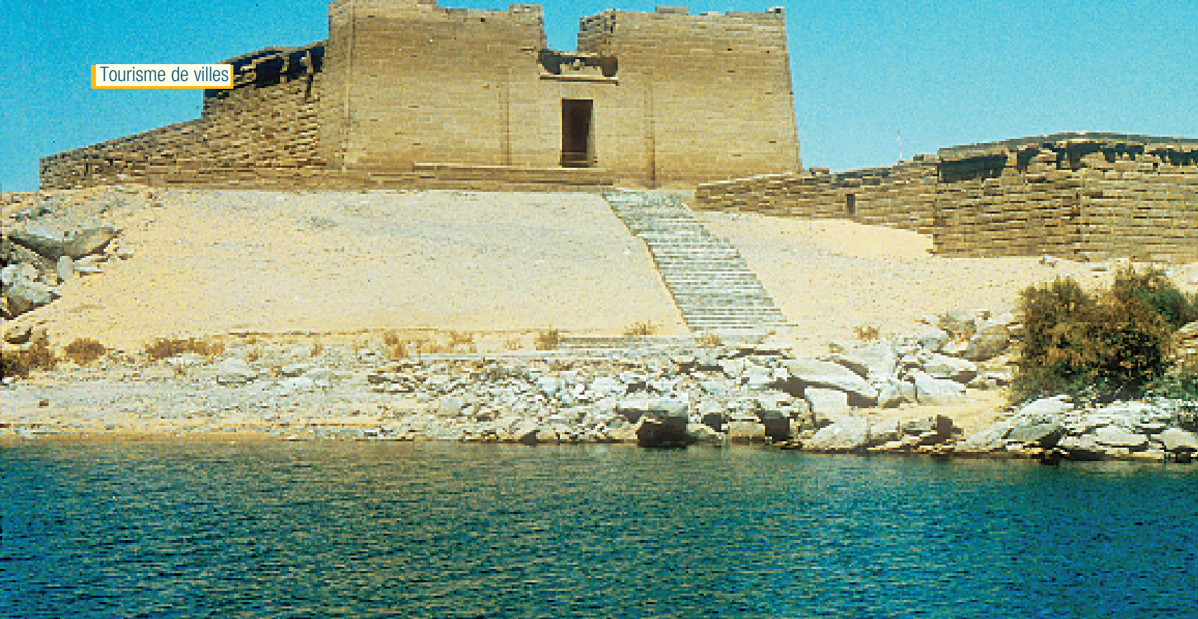
Temple de Kalabsha sur le lac Nasser