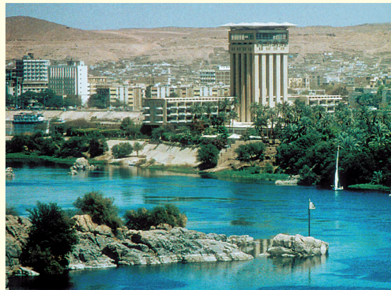
Le Nile et hôtel Oberol