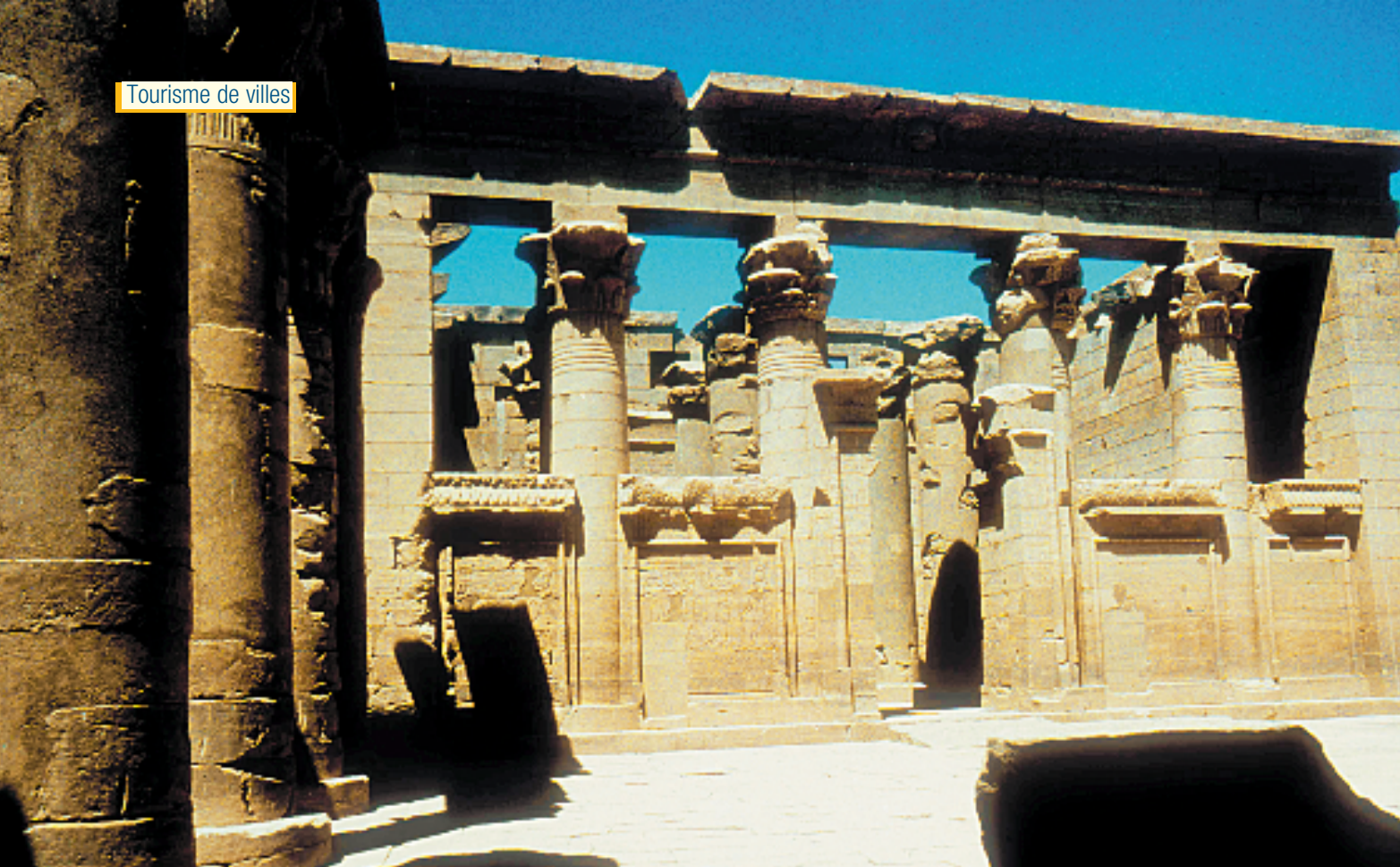
Temple de Kalabsha