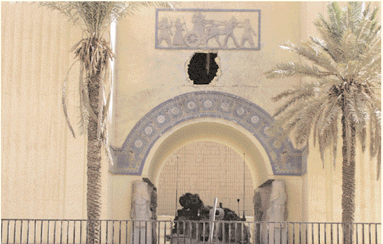
Le musée sous occupation.

L'Irak est incontestablement le berceau de la civilisation humaine et la première terre habitée. C'est aussi le pays où l'écriture a commencé et où l'homme a quitté la vie des cavernes pour habiter aux bords des rivières. Le Musée d'Irak situé au sud-ouest de Bagdad expose les fruits de 10 000 ans de la civilisation de ce pays très anciens. Logé à sa création en 1923 dans une petite salle dans le district Queshla, sur le côté Est, près de la rivière, le Musée irakien a été déplacé à son bâtiment actuel suite aux explorations des équipes scientifiques irakiennes et étrangères qui ont découvert de nouveaux trésors. ➔