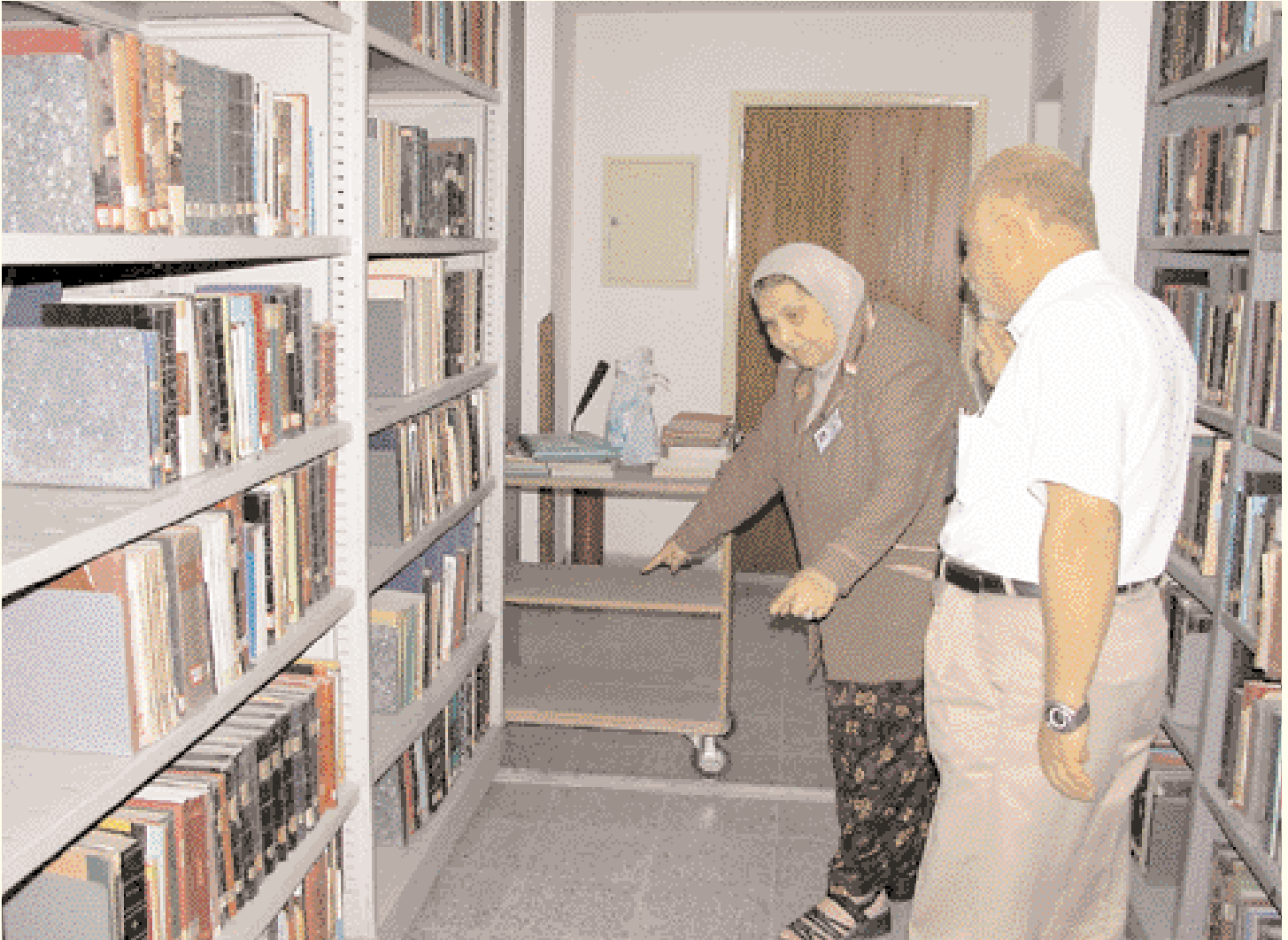
Le représentant du magazine écoutant les explications de la Directrice de la librairie.

مندوب المجلة يستمع إلى شروحات من مديرة المكتبة.