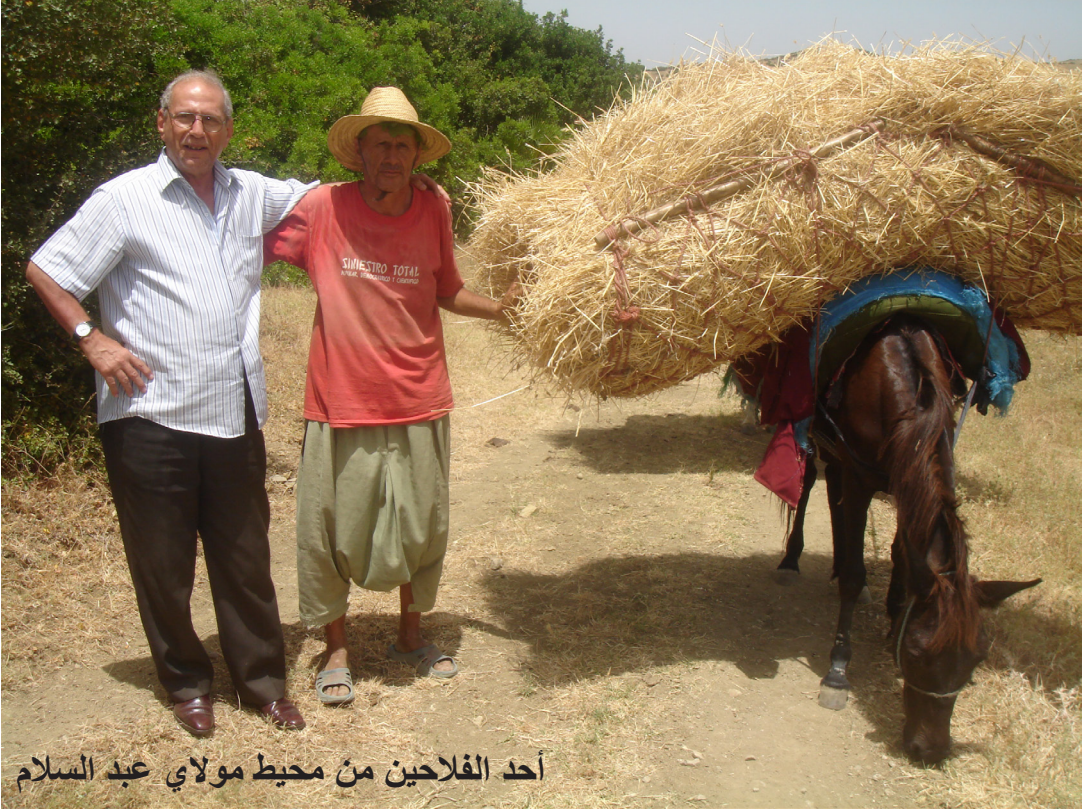
أحد الفلاحين من محيط مولاي عبد السلام

أحييت مؤخرا نقابة الشرفاء العلميين بجبل العلم بإقليم العرائش بالمملكة المغربية، الذكرى السنوية للقطب الصوفي أبي محمد عبد السلام بن مشيش تحت شعار "المدرسة المشيشية الشاذلية: وحدة و توحيد" ، حيث انفردت هذه السنة بحضور ما يفوق خمس مائة ألف زائر من مختلف الجهات المغربية بالإضافة إلى بعض ممثلي الأقاليم الجنوبية الذين أعربوا عن مدى تشبثهم المطلق و اللامشروط بمغربية الصحراء.