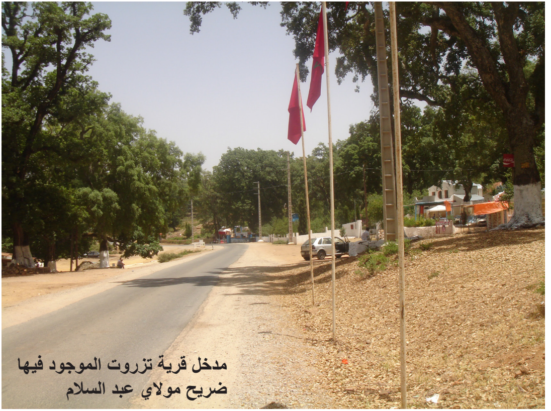
مدخل قرية تزروت الموجود فيها ضريح مولاي عبد السلام