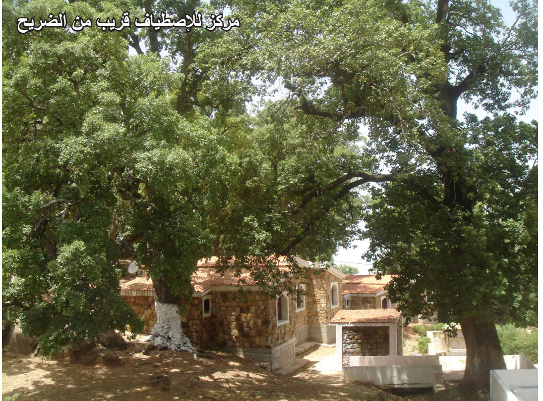
مركز للإصطيفاف قريب من الضريح

المحمدي و بالإسم الأعظم. فهذا النص الابتهالي يتضمن عدة مقامات عليية و سماوية من قبيل مقام المجاهدة، و مقام التوحيد. على المستوى الصوفي، تتدرج الطريقة المشيشية الشاذلية من المجاهدة و الفناء إلى بلوغ الحب الكامل الذي يتجاوز منطق العبارة ليشمل عوالم الاستبطان و النظر القلبي، حيث مقامات الجذب، و الخروج إلى السياحة لاستكمال مكارم الأخلاق، و تمثل مقام التقوى و الإحسان.