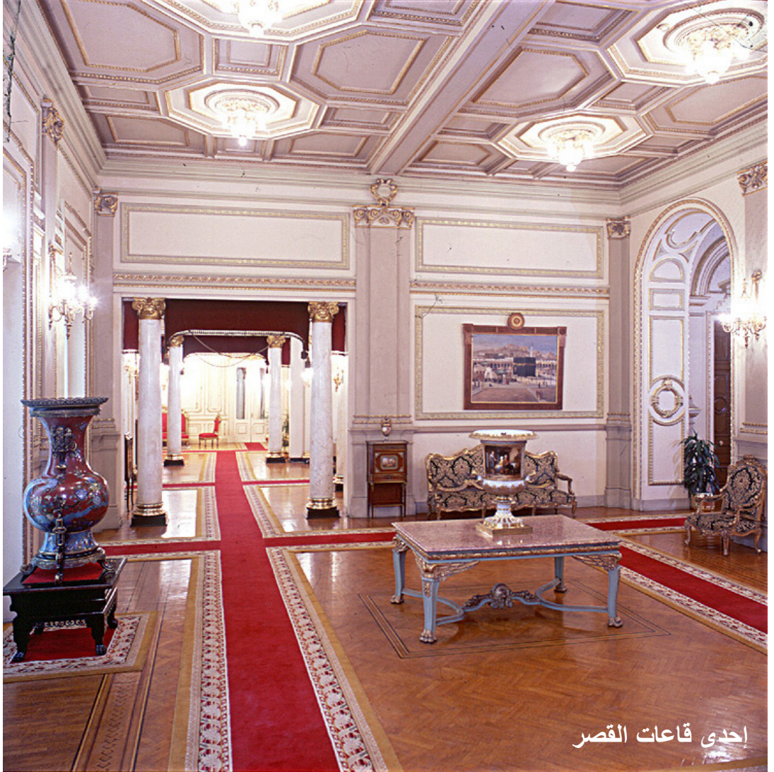
إحدى قاعات القصر

في إحدى مناطق الإسكندرية الهادئة تسمى "زيزينيا" وبجوار مقر إقامة محافظ الإسكندرية وجنوبا شارع أحمد يحيى، وشرقا شارع الفنان أحمد عثمان. إنه تحفة معمارية لها من الروعة ما لها، وهو ملك فيما سبق لإحدى أميرات الأسرة العلوية المالكة بمصر تسمى سنة 1919 فوق مساحة تقدر بـ 4185 مترا مربعا ويحده شمالا شارع عبد