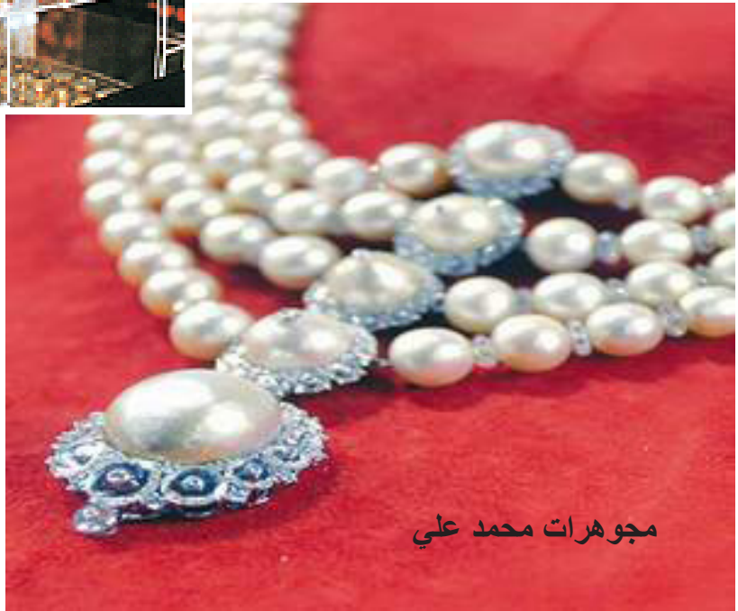
مجوهرات محمد علي