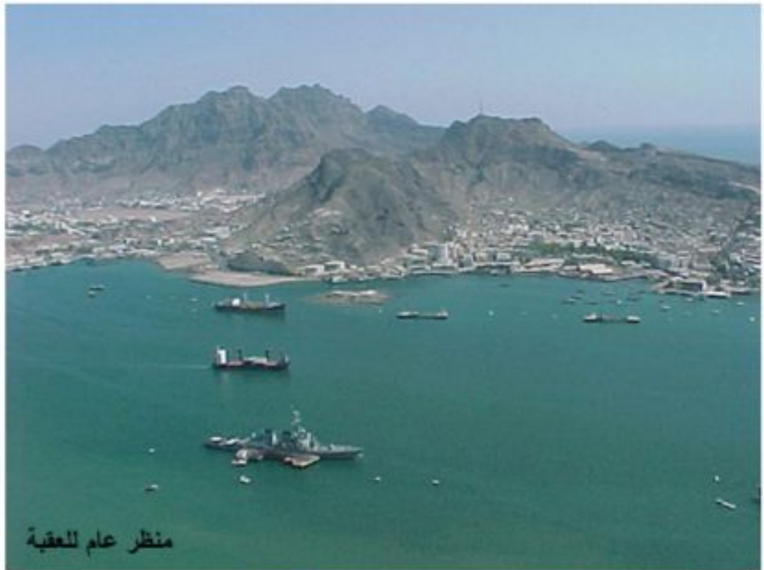
منظر عام للعقبة

أما ميزتها الثانية هي احتواؤها للعديد من المنتجات السياحية الراقية، ومراكز تجارية حرة، ومشاريع صناعية هامة. إنها باختصار شديد مدينة العقبة الأردنية التي استحققت أن تعلق عرش السياحة العربية، وتنال ثقة فاعليات السياحة العربية التي منحها لقب عاصمة السياحة العربية لسنة 2011، بعد مدينة