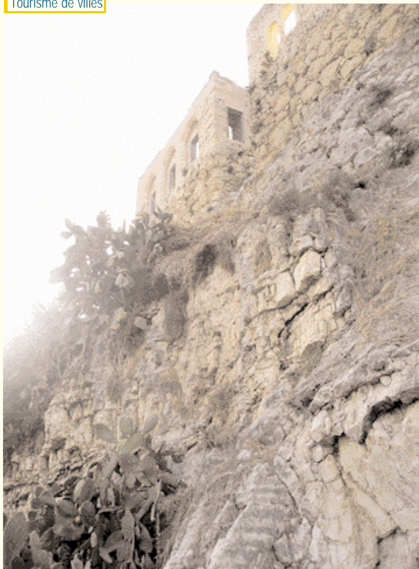
View of the walls.