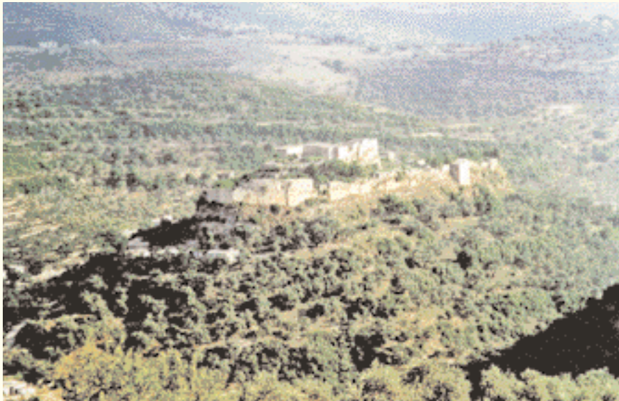
The green environment of olive trees.

Quand nous parlons souvent des citadelles et des tours, nous pensons en premier à leur architecture militaire avec ses caractéristiques particulières, et leur site qui est distingué habituellement par son emplacement sur des lieux hauts et rugueux inaccessibles pour les ennemis. Cependant, parler de la Citadelle Al Khawabi est une invitation pour visiter cette vieille architecture, pleine de magie et de mystère ; et qui est encore habitée de nos jours.