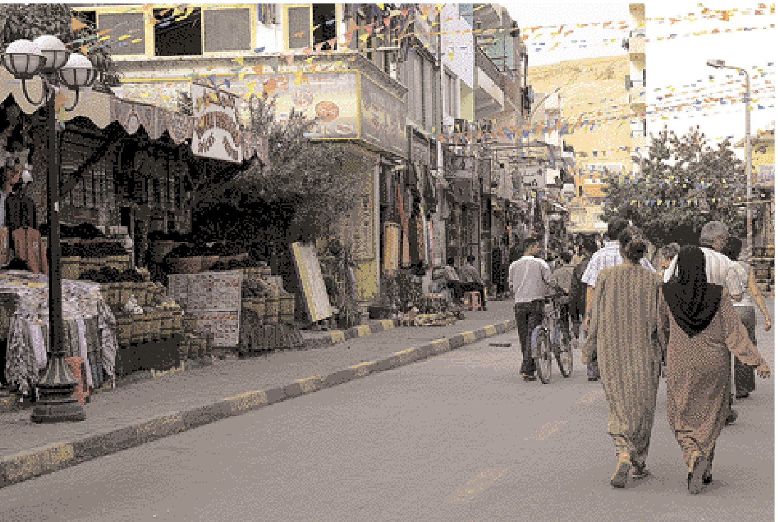
Eine der vielen Straßen von Ed-Dahar mit unzähligen kleinen Geschäften