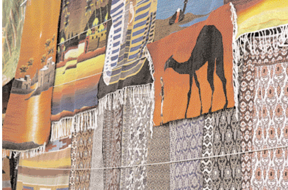
Teppiche in der Auslage

Auf den alten Märkten des Ed-Dahar Viertels, sind kaum noch Touristen unterwegs. Die Antwort auf die Frage eines Ladeninhabers, wo sie geblieben sind, wurde mir auf dem Rückflug klar: Sie hatten alle ihre Hotelkomplexe und Tauchbote nicht verlassen.