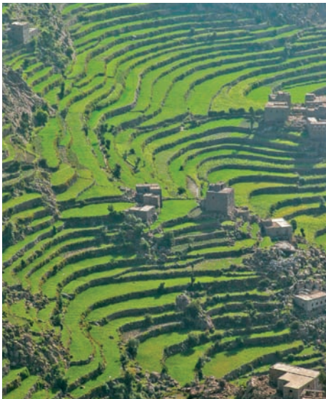
Green farming land