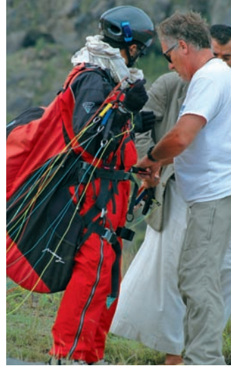
Checking the harnesses