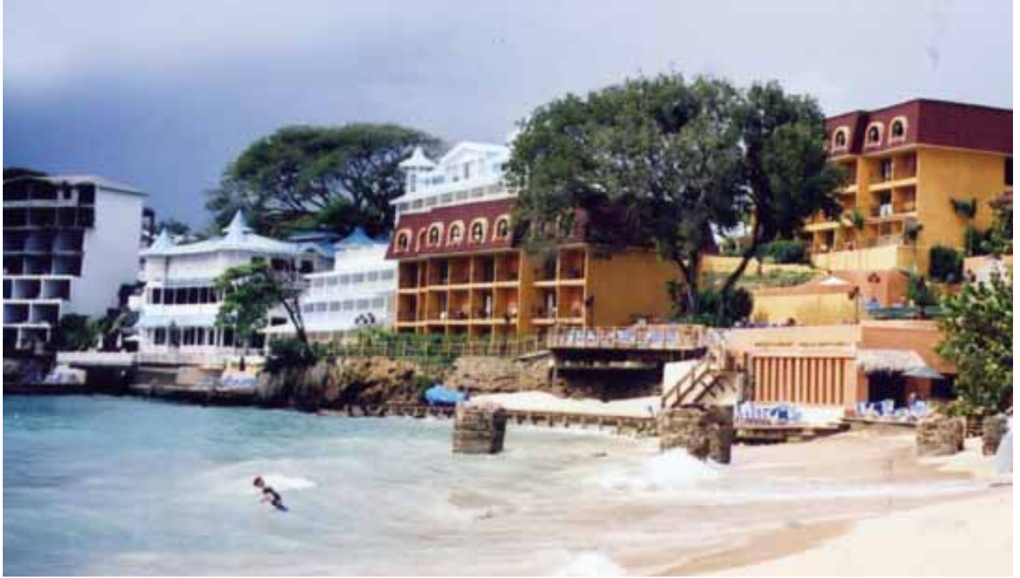
Sosua Bay Club Hotel & Beach