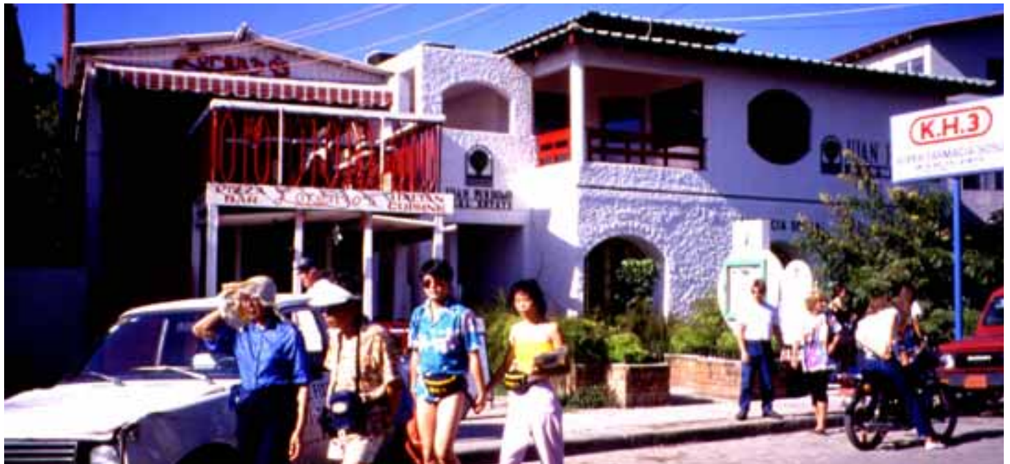
Sosua-El Batey area

وبخلاف دورادو، فإن رمال سوسوا محاطة بمجمعات المنتجع الضخمة، والاستثناء الوحيد هو منتجع خليج سوسوا، ويقع في نهاية الشاطئ، ومطلا على الرمال، وهو يكمل جمال المنظر والروح الودية لأهل الشاطئ، مضيفاً سحراً إلى السحر الذي يمتلكه هذا المنتجع الخفي والذي هو بحق مثال رائع للجمهورية الدومينيكية- وهي جزء من الهيسبانيولا- الجزيرة التي أحبها كولومبوس وفضلها على ما عداها. ■