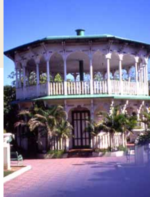
بويرتو بلاتا-المنتزه المركزي Puerto Plata -Central Park

تقع شواطئ دورادا وسوسوا على طول الساحل الشمالي لجمهورية الدومينيك. وهي من أهم المواقع السياحية في منطقة بويرتو بلاتا. وتجذب نسبة عالية من زوار البلد البالغ عددهم حوالي 2,5 مليون زائر. ورمالها الناعمة التي تغسلها أمواج مياه المحيط الأطلسي الفيروزية. وأحدث المرافق الحديثة المتوفرة فيهما. يناسبان بصورة مثالية طالبي الشمس والاسترخاء. جنباً إلى جنب مع وسائل الراحة التي يوفرها القرن الحادي والعشرون. ونظراً لوجود حوالي ستة شواطئ مشهورة إلى الشرق والغرب من بويرتو بلاتا. وهي مدينة سياحية عدد سكانها حوالي 200 ألف نسمة. وأكبر مدينة على الجانب الشمالي من الجزيرة. فهي تعتبر من أهم الأماكن التي يختارها السياح القادمون من أمريكا الشمالية في الشتاء.