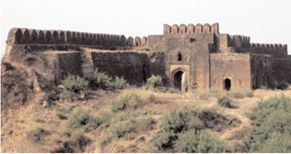
Una parte destruida