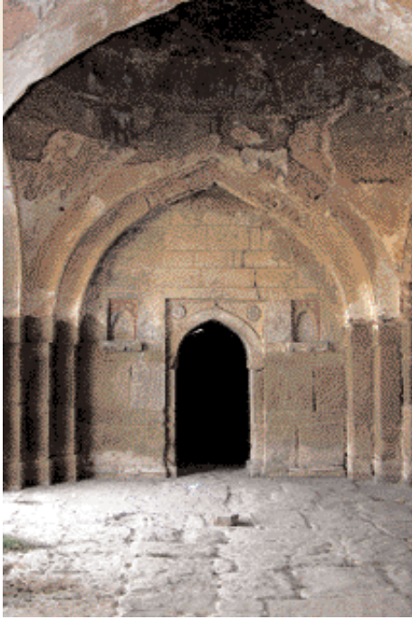
Mezquita dentro de la fortaleza

تقع قلعة روهتاس حوالي 109 كم من روالبندي، وحوالي 6 كم جنوب غرب مدينة دينا. وهي قطعة فنية رائعة تعكس ذوقا عمرانيا رفيعا لدى المسلمين الذين فتحوا المنطقة. والقلعة العملاقة مبنية على جرف صخري حاد مطل على نهر كاهان، وأسوارها محصنة من الجهة الشمالية الغربية بالنهر، وبالتلال العالية من جهتي الشرق والجنوب.