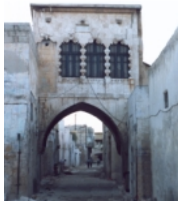
المدينة القديمة The Old Town

وتعدّ إدلب إحدى أقدم ممالك التاريخ. وأهم المكتشفات الأثرية فيها في القرن العشرين المكتبة الملكية التي احتوت على 17.000 رقيم ولوحة طينية عام 1975. وقد ضمت المكتشفات مملكة ابلا العظيمة بقصرها الملكي وكهوفها الصخرية وقبور العائلة المالكة والمجوهرات والأسلحة والمحتويات العاجية ومقتنيات أخرى. من يزورها لا بد أن يشدّ الرجال إلى كنيسة قلب لوزة، وهي من أجمل كنائس العالم، وتعود للقرن الخامس الميلادي، وبجانبها كنيسة قرق بيزة، وهي من أقدم كنائس الشرق، وحولهما مجموعة من المدن المنسية. أما البروج الهرمية الفريدة فهي في سيرجيبا والبارة والمعرة. في المعرة يجثم قبر فيلسوف الشعراء وشاعر الفلاسفة أبي العلاء المعري، وغير بعيد عنه يرقد الخليفة العادل عمر بن عبد العزيز وزوجته فاطمة بنت عبد الملك، وهناك متحف المعرة والذي هو ثالث أكبر متحف فسيفساء في العالم، وخاناتها ومدينتها القديمة وقلعتها الشامخة.