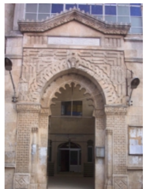
The minaret of the Grand Mosque in Takharim مدخل جامع كفر تخاريم

Idleb is welcoming every visitor with love. Its greenery is a permanent invitation card. ■