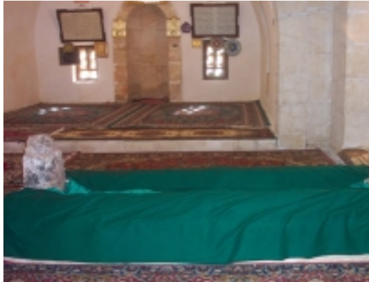
ضريح الخليفة عمر بن عبد العزيز The tomb of Caliph Omar Bin Abdul-Aziz