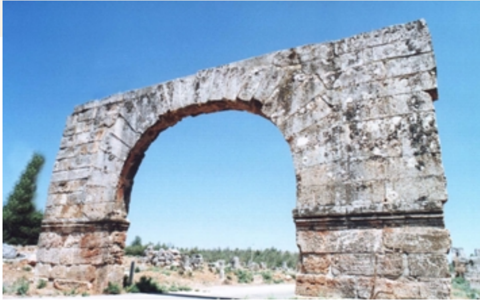
Bab Al-Hawa-The gate to Europe

”إدلب قطعة من الجنان، وغابة مثمرة“. هذا ما وصفها به الرحالة الفرنسيون. وهي محافظة سورية تقع في الشمال الغربي من البلاد. يحدها من الشمال تركيا، وشرقاً حلب، وجنوباً حماة، وغرباً اللاذقية. مساحتها حوالي 610.000 هكتار وعدد سكانها حوالي 1.750.000 نسمة، وهي البوابة العربية على الأناضول وأوروبا وعقدة مواصلات هامة، مما جعلها موطناً لأكبر الحضارات، وفيها للتاريخ صوت، وللتراب أريج، وللحضارة أثر، فينتشر على أصقاعها 650 موقعاً أثرياً أي حوالي ثلث آثار سوريا.