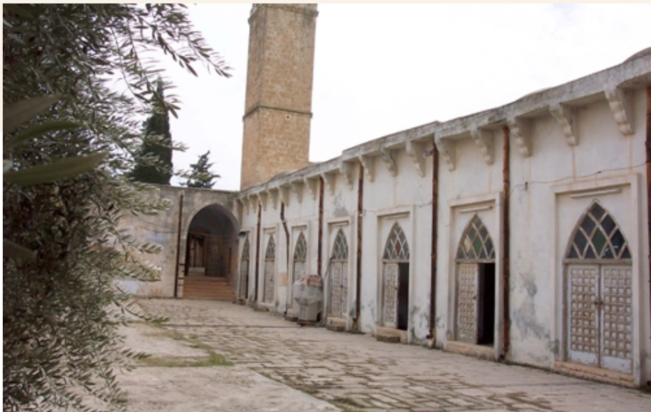
The Grand Mosque in Sarmin

"Idleb is a piece of heaven and a fruitful forest". This is how a French traveller described the Syrian province in the north-west of the country, bordered to the north by Turkey, Hama from the south, Aleppo from the east and Latika from the west.