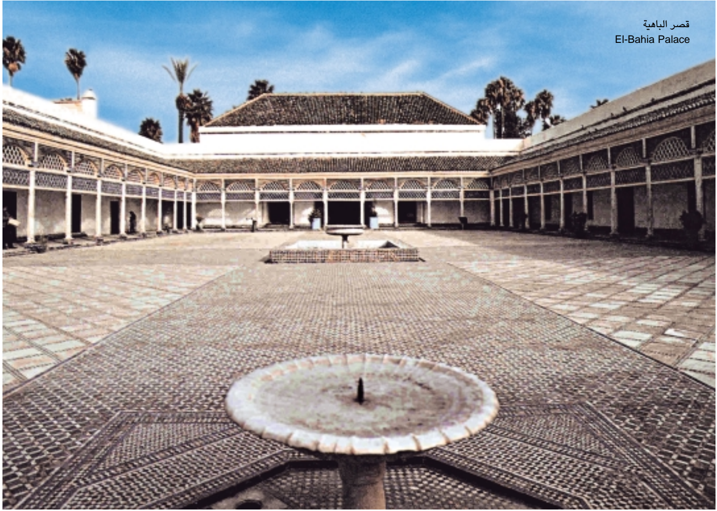
قصر الباهية El-Bahia Palace

وخلال الاستعمار الفرنسي للبلاد، وتحديدًا في سنة 1913، بدأت مدينة مراكش، تعرف تطوراً ملحوظاً شمل عدة جوانب إذ ظهرت أحياء جديدة ذات طابع معماري مختلف تغلب عليه المباني الشاهقة والفنادق الفخمة لكن هذا لم يفقد المدينة ذلك الطابع العتيق الخاص بها.