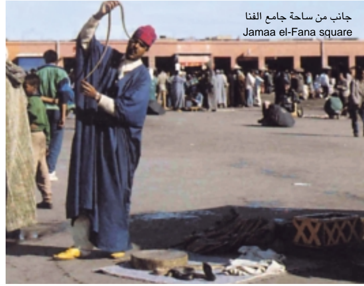
جانب من ساحة جامع الفنا Jamaa el-Fana square