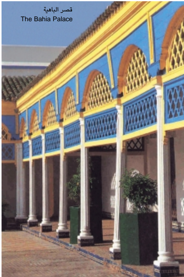
قصر الباهية The Bahia Palace

وتمتد مدينة "مراكش الحمراء" في سحر تحت شمس ساطعة وسط أسوار عالية يتغير لونها ما بين الأصفر الداكن والأحمر. وبين أحضان هذه الأسوار تلوح في الأفق وتنتصب في شموخ في وسط المدينة صومعة "الكتبية" نموذجاً حياً للفن المعماري الإسباني الموريسكي الذي اشتهر به العهد الموحي. صومعة الكتبية تلك المعلمة الفنية التي بناها "عبد المؤمن" وأتم بناءها "يعقوب المنصور" في ما بين 1184-1189م والتي يبلغ ارتفاعها نحو 77 متراً وهي فريدة من نوعها ليس فقط من الناحية المعمارية بل وحتى الجمالية ويؤكد المعماريون. أنها كانت النموذج الأصيل لصومعة "حسان" ذلك الصرح الذي تم تشييده فيما بعد بمدينة الرباط سنة 1195م. وتزين اللوحات قاعات "مسجد الكتبية" الست المنفتحة على بعضها البعض ويدور حول الصومعة فناء رحب قائم على عدد من الأعمدة يبلغ طول الواحدة منها مترين. وعلى بعد أمتار، توجد ساحة "جامع الفنا" ذلك المجال الواسع الذي بات اليوم أكثر من ذي قبل من بين الأبنية التي تميّز المدينة وتضفي عليها حيوية وديناميكية لا مثيل لها. والساحة تشبه إلى حد كبير خشبة مسرح تمتد على حوالى (150 متر X 100 متر) ما بين الكتبية والمدينة هي ملتقى يخيل إليك أنه يجمع كل سكان المدينة بل كل سكان العالم ومراة تعكس الماضي والحاضر ولوحة يتناسق فيها السمعي والبصري. والمثير للانتباه أن هذا المسرح الرحب والمتنوع العروض المليء بالحركة والصخب لا يحتاج تذكرة للدخول فهو مفتوح على مصراعيه طيلة أيام الأسبوع ليلاً ونهاراً. وتمتد فيه الألوان وكذلك أصوات الباعة المنتشرين هنا وهناك بأنغام مختلف الآلات الموسيقية التي تداعبها أنامل موسيقيين تحيط بهم جموع غفيرة من