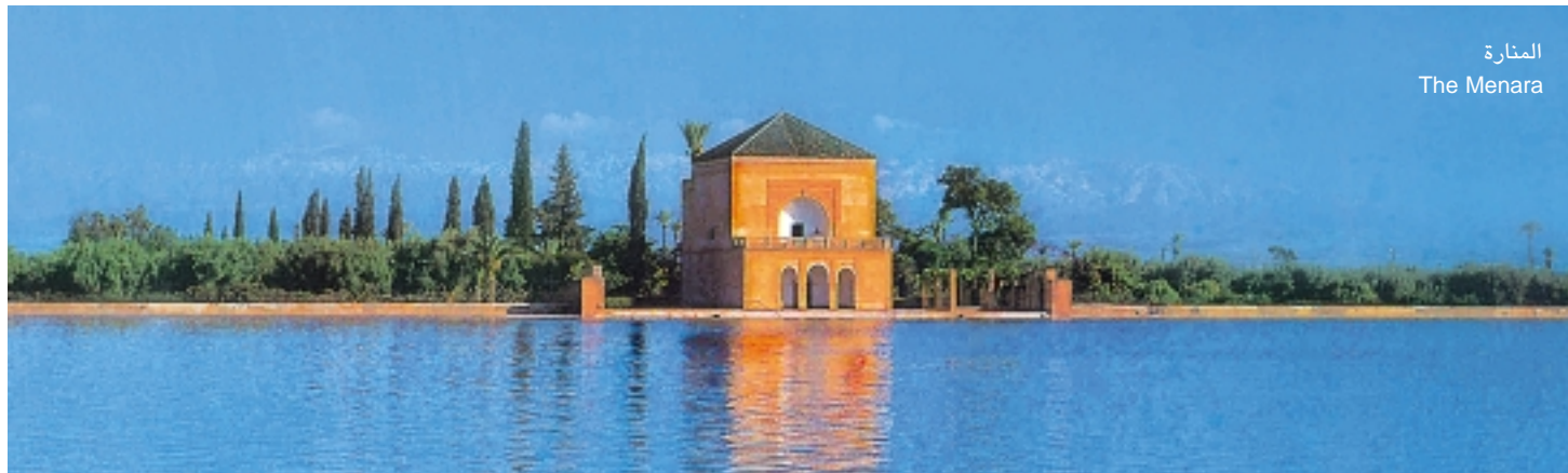
المنارة The Menara