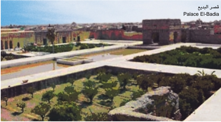
قصر البديع Palace El-Badia

وسقفها منحوت من خشب أشجار الأرز. ويقال أن بناء وتزيين هذه القاعات الضخمة قد تطلب نحو ثلاث سنوات وأزيد من ثلاثة آلاف عامل وحرفي.