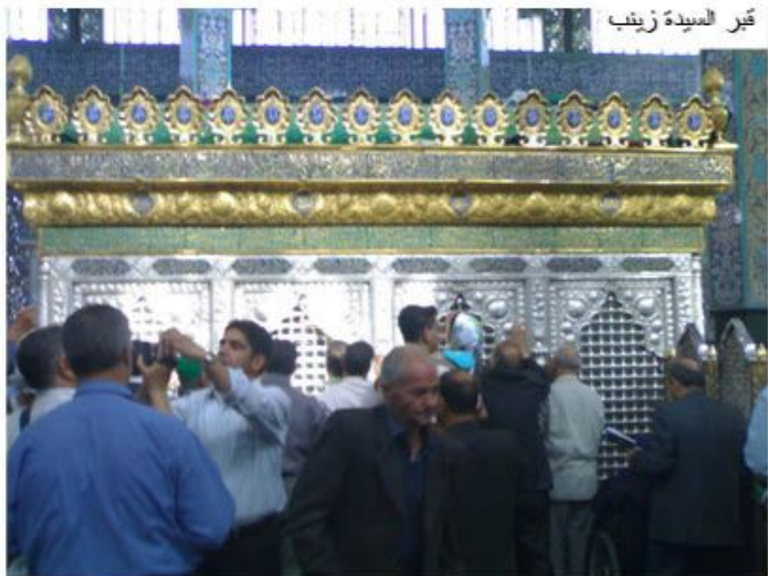
قبر السيدة زينب

في الورقة التالية سوف أتناول موضوعاً خاصاً بالمزارات الإسلامية في سوريا كرمز للسياحة الدينية في هذا البلد ذي الأصل العريق، والجامع لعدة حضارات مضت تبقى أبرزها الحضارة الإسلامية. وسأكتفي هنا بوصف مختصر عن مزار (ناحية السيدة زينب) الذي يعد من أهم مراكز السياحة الإسلامية الكثيرة في سوريا.