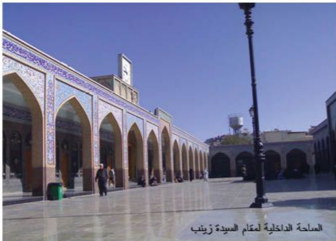
الساحة الداخلية لمقام السيدة زينب

تعتبر المزارات والمآثر الدينية (إن وجدت) في أي بلد كيفما كان، قيمة مضافة لسياحة ذلك البلد، مع امتيازات تتعدى المادية منها إلى الروحية، لما تنسم به زيارة تلك الأماكن الدينية من منح خشوع لزارها وتذكيره بحكمة الله وتقوية الجانب الأخلاقي منه، وشحن نفسه بنوايا البر والإحسان، وتحفيزه على فعل الخير والتأزر، والحث على السلام بين كل أجناس البشر. أضف إلى هذا وذاك تلك المنافع الأخرى المتجلية في السياحة الترفيهية والثقافية والإستجمامية... الخ.