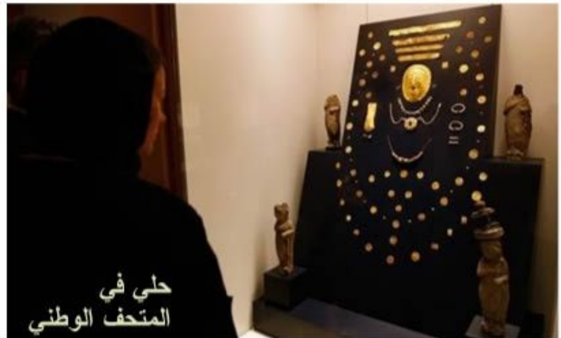
حلي في المتحف الوطني

قاعة الدولة السعودية الأولى والثانية إن قيام الدولة السعودية ابتداء من 850- 1309 هـ الموافق 1446-1819م غير مجرى التاريخ السياسي في شبه الجزيرة العربية، وتعد هذه الفترة التاريخية هامة بكل المقاييس، ولهذا خصصت قاعة لعروض تهم أحوال الجزيرة العربية للفترة ما قبل قيام الدولة السعودية