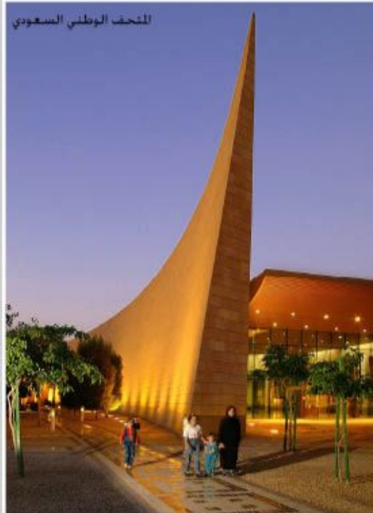
المتحف الوطني السعودي

العروض بهذه القاعة تهتم الحج عموماً منذ أقدم العصور حتى يومنا هذا ويتجلى ذلك في خمسة أقسام: قسم « مجسم لمكة