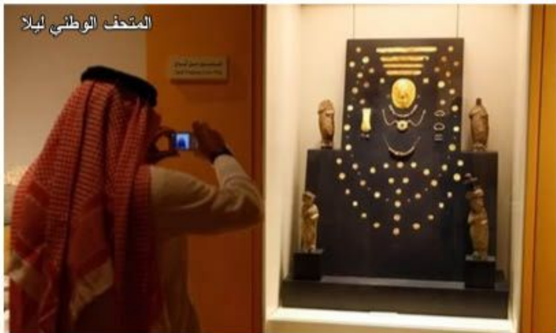
المتحف الوطني ليلا

صمم المتحف الوطني السعودي في طراز هندسي رفيع، على موقع استراتيجي وفوق مساحة سبعة عشر ألف متر مربع من الجانب الشرقي لمركز الملك عبد العزيز التاريخي، في حين تصل المساحة الإجمالية لمبناه، المكونة من طابقين، ثمانية وعشرين ألف متر مربع. ويوفر المتحف بيئة تعليمية بوسائل جد حديثة لشرائح مختلفة من المجتمع، ولمستويات مختلفة ومتعددة. وقد زاد تنوع وقيمة التحف التاريخية والتراثية والثقافية المعروضة من أهمية المتحف، وأهمها: القطع الأثرية المتنوعة المشارب، والوثائق الدامغة، والمخطوطات الثقافية، ولوحات