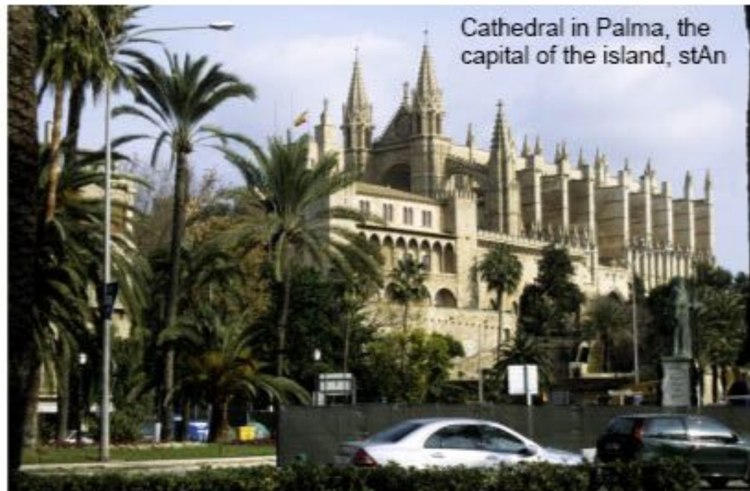
Cathedral in Palma, the capital of the island, stAn

devenue Madina Mayurqa un centre culturel important. L'île connut une période de grande prospérité. Les musulmans développèrent l'agriculture irriguée et l'artisanat local. Lors de la décomposition du califat de Cordoue en 1015, Majorque releva tout d'abord du royaume de Denia avant de devenir, entre 1087 et 1114 un des nombreux royaumes dits Taifas.