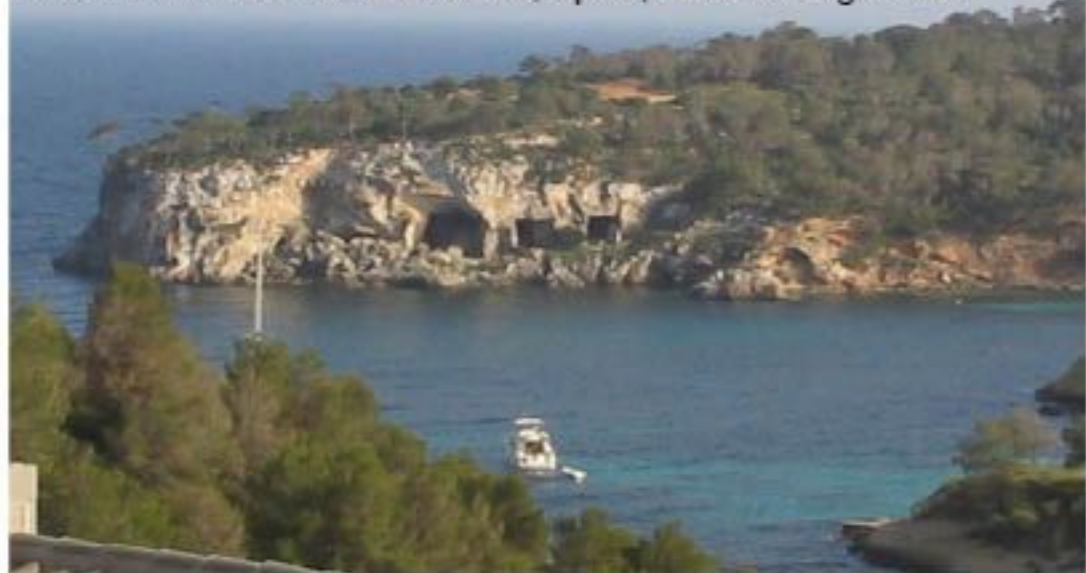
Caves of Portals Vells in Mallorca, Spain, Rafael Ortega Díaz

Dans le versant sud de l'île, on trouve les plus belles plages, avec des baies frangées de pins et de sable blanc et fin. Les petites routes de l'ouest de l'île mènent à une végétation abondante d'oliviers, d'aloès et de cyprès. En atteignant le haut de la montagne, on découvre un panorama paradisiaque.