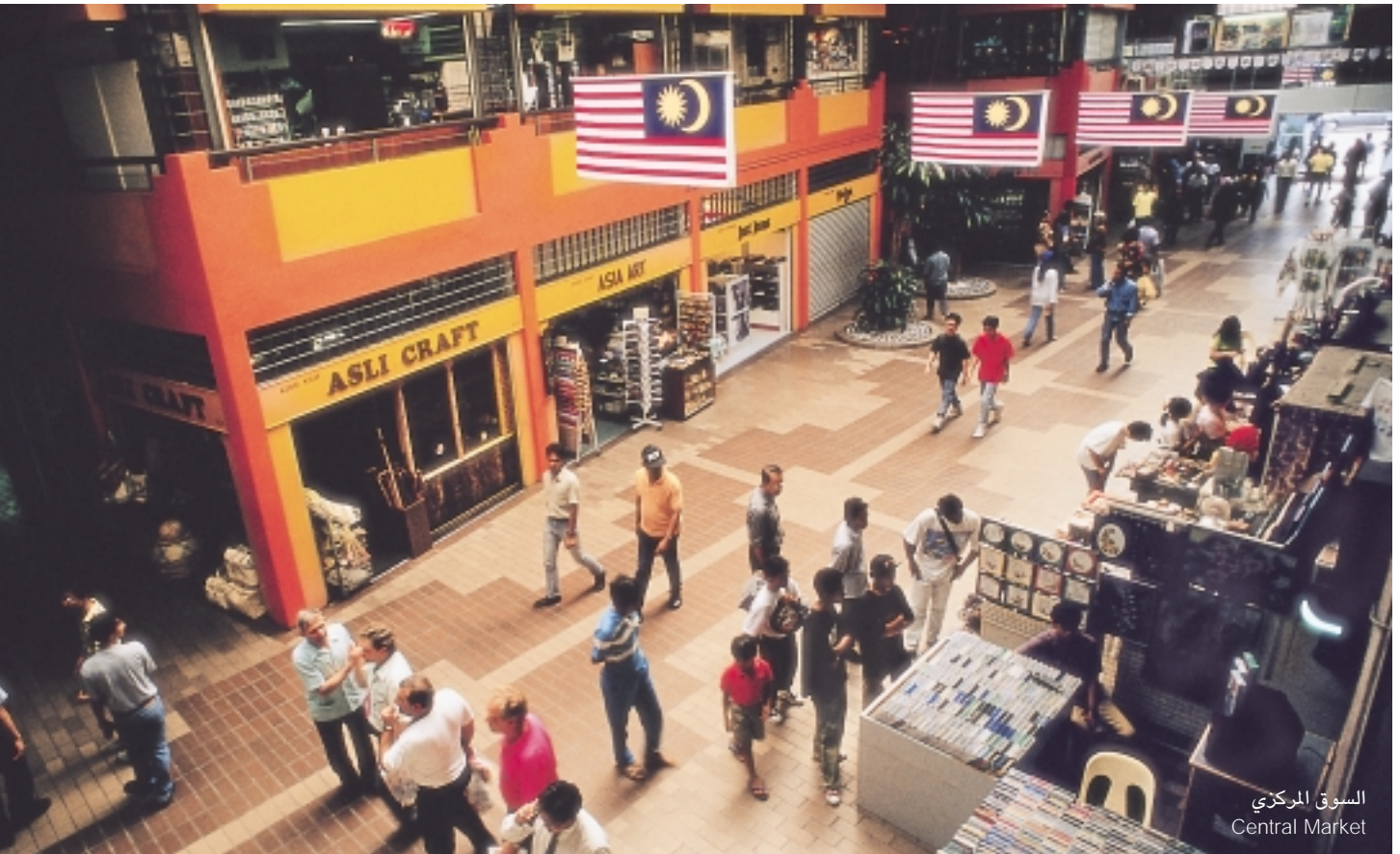
السوق المركزي Central Market