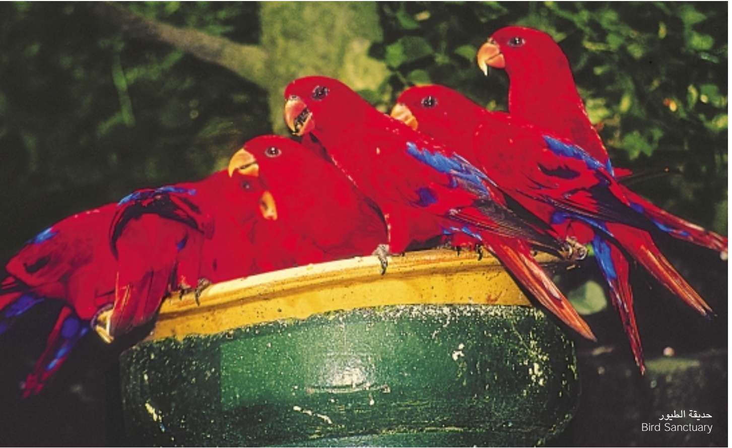
حديقة الطيور Bird Sanctuary