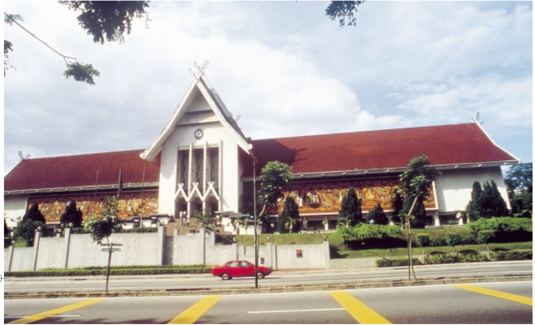
المتحف الوطني National Museum

”حصلت كوالا لمبور، التي تعرف اختصاراً بـ ثج، على وضع المدينة في الأول من فبراير / شباط عام 1972 وأعلنت إقليمياً فدرالياً عام 1974. نشأت كوالا لمبور كمركز تجاري متواضع للمصدر في القرن السابع عشر الميلادي بعد اكتشاف المعدن فيها عند التقاء نهري كومباك وكلانغ.