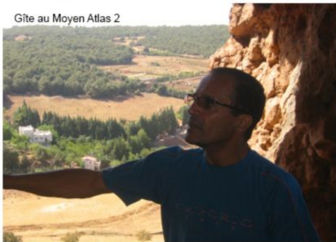
Gîte au Moyen Atlas 2

En ce sens, le salon a pour objectif de faire connaître aux marocains la beauté et la diversité des sites ruraux de leur pays, ainsi que leurs variétés culturelles, architecturales et gastronomiques. Le salon «Gîtes et Auberges» s'inscrit dans une stratégie de promotion du