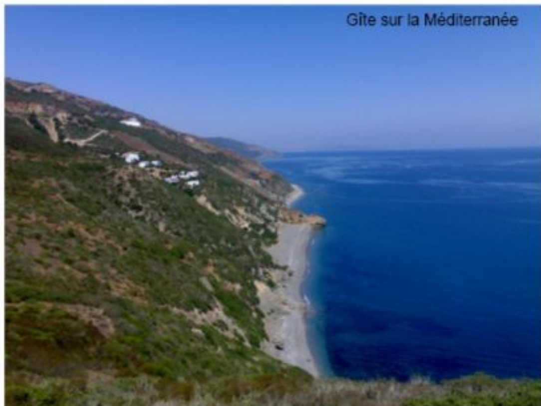
Gîte sur la Méditerranée

Le tourisme de gîtes et auberges a un avenir prometteur au Maroc du fait de son impact socioéconomique dans ces régions reculées, et aussi du fait que beaucoup de Marocains trouvent de plus en plus de difficultés pour avoir un visa, et donc se retournent sur les produits touristiques locaux. Et pour les citadins, il n'y a pas mieux que les contrées rurales pour se dépayser.