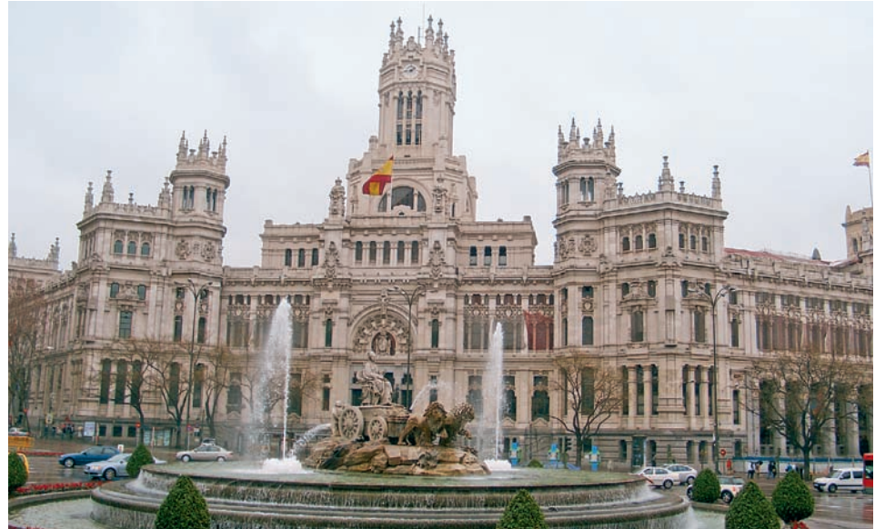
Der Plaza de la Cibeles

Das heutige Madrid ist eine moderne, schnelllebige Stadt, eine funktionale, quirlige Metropole und aufgrund der vielen noch erhaltenen Bauwerke aus der habsburgischen Zeit eine prunkvolle Hauptstadt. Sie mag sich aufgrund ihrer ökonomischen und politischen Bedeutung zu Recht als die Königin unter Spaniens Städten bezeichnen. Und sie ist aufgrund ihrer weltweit einmaligen Museen und Sehenswürdigkeiten jederzeit einen Besuch wert. Aber es gibt Touristen, die bestreiten, dass sie auch zu den „Schönen“ des Landes gehört. Viele vermissen beim Bummeln dann doch irgendwie die Zeugnisse der mittelalterlichen Kulturgeschichte, mit denen all die anderen „Schönheiten“ des Landes aufwarten. ■