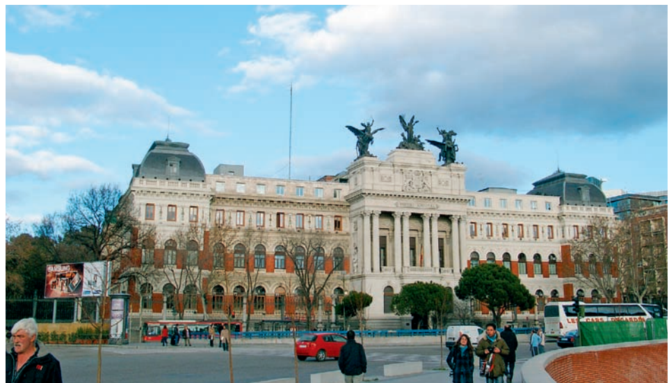
Gebäude am Paseo del Prado-Komplex