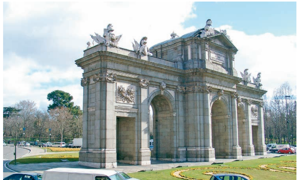
Puerta de Alcalá