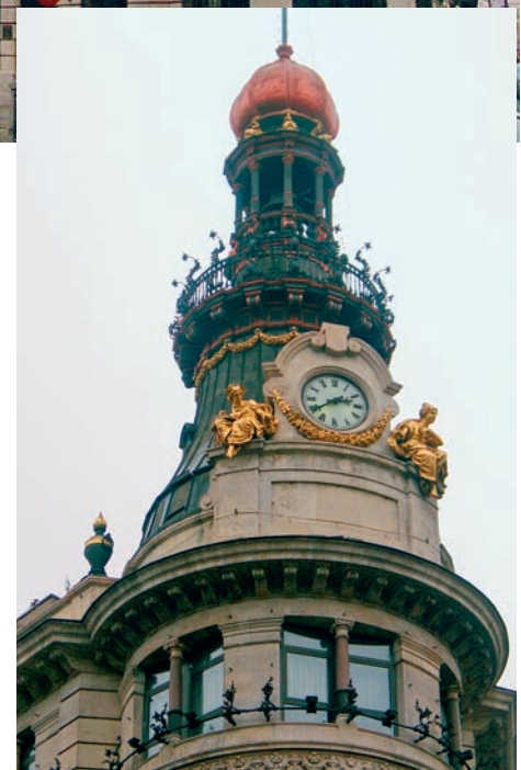
Die Spitze des Palacio de la Equitativa البلاسيو دي لا إيكواتيفا